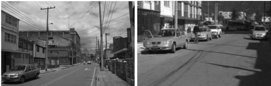
Figura 1. Superficies viales de investigación. a) Fontibón-Zona 1, y b) Barrios Unidos-Zona 2