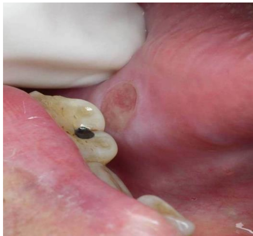
FIGURA 7 ÚLCERA TRAUMÁTICA CRÓNICA EN BORDE LATERAL DERECHO DE LENGUA (OBSÉRVESE LA RELACIÓN CON DIENTE POSTERIOR INFERIOR DERECHO)

La úlcera traumática crónica (UTC) es una pérdida de sustancia profunda y crónica de la mucosa que se presenta con un área central amarillenta o sangrante rodeada de un halo eritematoso y bordes crateriformes, que no tiende a cicatrizar. Se origina de afuera hacia adentro y tiene tamaño y profundidad variables. La UTC es una lesión muy frecuente en la cavidad oral (64). Su etiología es el trauma mecánico crónico y persistente ocasionado por dientes con bordes cortantes, prótesis en mal estado o alimentos muy duros (65). Estas lesiones pueden cicatrizar si se retira el agente causal de inmediato. Sin embargo, algunas llegan al estado crónico. Epidemiológicamente, se puede encontrar en ambos sexos, con variabilidad respecto de la edad. Usualmente, las UTC se ubican hacia los bordes laterales de la lengua, la cara interna de las mejillas, los labios y esporádicamente el paladar, esto es, zonas de alto roce dentario (65) (figura 7).