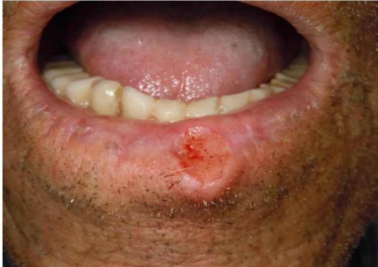
FIGURA 5 ÚLCERA EN SEMIMUCOSA LABIAL INFERIOR Y BORDE BERMELLÓN EN PACIENTE CON QUEILITIS ACTÍNICA*

Clínicamente se evidencian áreas secas, fisuradas y con escamas sobre la semimucosa labial inferior, debido a que el labio está más expuesto a la radiación ultravioleta y su epitelio es más delgado pues posee una fina capa de queratina con menor cantidad de melanina (53). Algunas veces están acompañados de ampollas características de quemadura en su forma aguda. El labio se observa hipotónico, con descamación de la semimucosa labial y xerosis. Pueden encontrarse áreas atróficas, leucoplásicas, erosiones y costras (figura 5), con periodos de mejoramiento y recidiva. Puede también presentar dolor y sangrado. Un aspecto relevante es la pérdida del borde bermellón, es decir, no hay una clara separación entre la semimucosa labial y la piel (54).