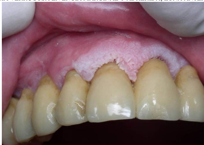
FIGURA 3 LEUCOPLASIA VERRUGOSA EN ENCÍA MARGINAL Y ADHERIDA, ZONA ANTEROSUPERIOR*

La leucoplasia se observa clínicamente como una lesión única en forma de mancha placa o verrugosidad localizada, que abarca una amplia área de la mucosa oral. Se clasifica en homogénea y no homogénea. La leucoplasia homogénea muestra un color blanco uniforme, patrón que por lo general no está acompañado de infección por Candida , y suelen ser asintomáticas (35). Entre tanto, la no homogénea es una lesión predominantemente blanca, de superficie irregular, sintomática y existen tres tipos: eritroleucoplasia, nodular y exofítico. La variante eritroleucoplasia es una lesión blanca en la que se presentan zonas rojas; en la leucoplasia nodular se presentan nódulos ligeramente elevados y redondos; en la leucoplasia exofítica la lesión es verrugosa blanca con proyecciones irregulares filiformes (figura 3) (31-34,36-37).