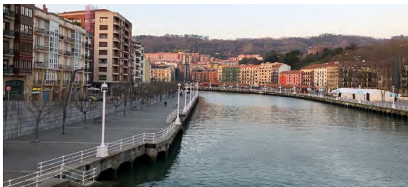
Figura 2. Imagen actual de la Ría, saneamiento de las aguas y recuperación de áreas aledañas

ferroviaria con el aeropuerto, además de proyectos menores como el mejoramiento de sendas peatonales y ciclísticas en los barrios centrales; y 2) medidas medioambientales regionales como el Plan de Reducción de Contaminación Atmosférica, la gestión de residuos urbanos, la incorporación de más áreas verdes, la construcción de colectores y, principalmente, el Plan de Saneamiento de las Aguas de la Ría, que permitió la reestructuración de áreas centrales a la fecha abandonadas, y con altos niveles de deterioro urbano y ambiental (figura 2). Ambos aspectos se encuentran en la escala metropolitana.