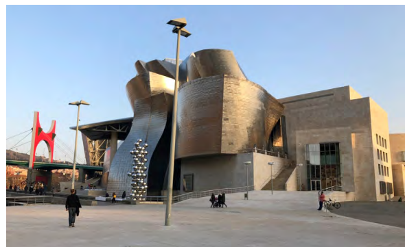
Figura 3. Museo Guggenheim de Bilbao

a manos de la corporación y sus intereses, todo bajo la premisa de convertir las “zonas problema” en “zonas de oportunidad” (Ayuntamiento de Bilbao, 2016). El proyecto más visible de esta reconversión urbana fue la construcción del Museo Guggenheim de Bilbao (figura 3), a cargo del famoso arquitecto Frank Gehry, que alberga la colección de arte contemporáneo de la fundación homónima, y se ha transformado en un ícono de la ciudad y ejemplo de la monumentalidad en la obras que propone la planificación estratégica (Guasch y Zulaika, 2007).