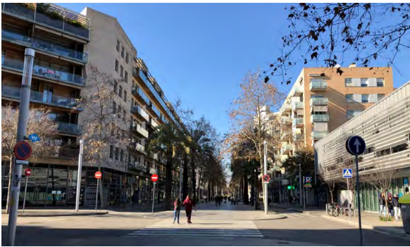
Figura 6. Nueva imagen urbana barrio Poblenou

En este sentido, resulta interesante cuestionar esta “flexibilidad” elevada como un valor, pues en la práctica se traduce en laissez faire para los desarrolladores, la que parece haberse convertido en una necesidad de la planificación urbana actual. La desregulación ha sido factor clave para alto dinamismo y alta asociatividad entre los agentes económicos urbanos en este barrio (Boixader, 2005). Asimismo, la transformación espacial y social que supuestamente ha permitido al barrio convertirse en ícono de las últimas tendencias del desarrollo, ha debido ser impulsada activamente por las autoridades políticas, tanto a nivel discursivo como con incentivos económicos (Casellas y Pallares-Barbera, 2009).