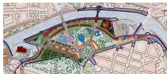
Figura 1. Esquema general del Plan Bilbao Ría 2000, sector Abandoibarra

a las autoridades regionales a idear un plan de reconversión de amplio espectro. En 1992, se fundó la corporación público-privada Bilbao Ría 2000, con el objetivo de gestionar un plan estratégico “de inversiones” (Ayuntamiento de Bilbao, 2016), con dos tipos proyecto: 1) los físicos, que incluían regenerar ambientalmente la Ría, reconvertir suelos industriales en otras actividades (figura 1), y una serie de esfuerzos públicos en transporte, áreas verdes y bienes urbanos (Álvarez, 2002); y 2) los productivos, que incluían transformar la económica industrial a una terciaria (turismo e industrias creativas), invertir en recursos humanos y tecnologías, y consolidar a Bilbao como capital cultural de Europa.