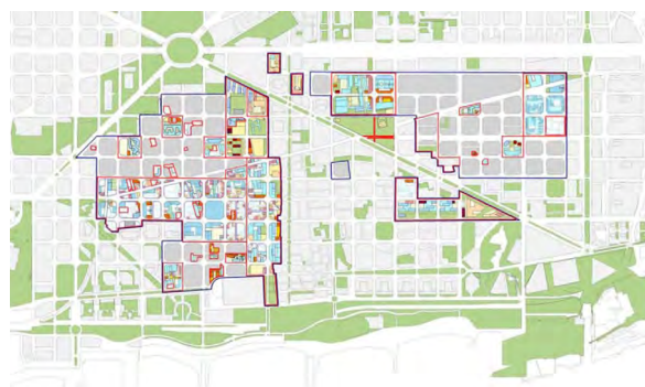
Figura 5. Nuevas edificaciones e infraestructura de movilidad motorizada y peatonal

A pesar de que no son parte del plan específicamente, la zona ha sido gran foco de inversión pública, donde se creó un moderno sistema de tranvía en superficie, la estación intermodal de La Sagrera, la renovación de la Plaza de las Glòries, y las infraestructuras del Foro Universal de las Culturas 2004. Además, el ayuntamiento fue importante en la decisión de localización de un proyecto corporativo de gran envergadura y simbolismo como es la Torre de las Glòries o Agbar, diseñada por el arquitecto francés Jean Nouvel, con especial énfasis en la innovación tecnológica y ambiental (figura 5); paradójicamente este gran edificio busca en la actualidad reconvertirse en infraestructura turística.