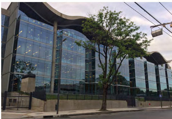
Figura 8. Nueva sede del Gobierno de la ciudad

Entre estos últimos, destaca la inauguración, en el año 2015, del nuevo edificio de la Jefatura de Gobierno de la Ciudad de Buenos Aires (figura 8) en el barrio de Parque Patricios (Distrito Tecnológico), el cual fue diseñado por el arquitecto Norman Foster, y ha sido internacionalmente reconocido por su diseño de altos estándares de eficiencia energética y sustentabilidad. En cuanto a la infraestructura de movilidad, destacan la extensión de la red de Metro o Subte y la creación de una red de carriles exclusivos o BRT (Metrobús del Sur), además de la ampliación de la red de ciclovías.