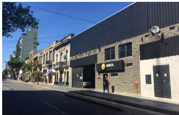
Figura 9. Ciclovías y nuevas edificaciones en el Distrito Tecnológico

Distritos como propuestas modernizadoras y el carácter popular de las zonas intervenidas (Thomasz, 2017); así, no es extraño que los estudios urbanos críticos propongan procesos de turistificación, gentrificación o patrimonialización (Herzer, 2012; Hernández, 2017) como formas de legitimización de espacios de alta desigualdad.