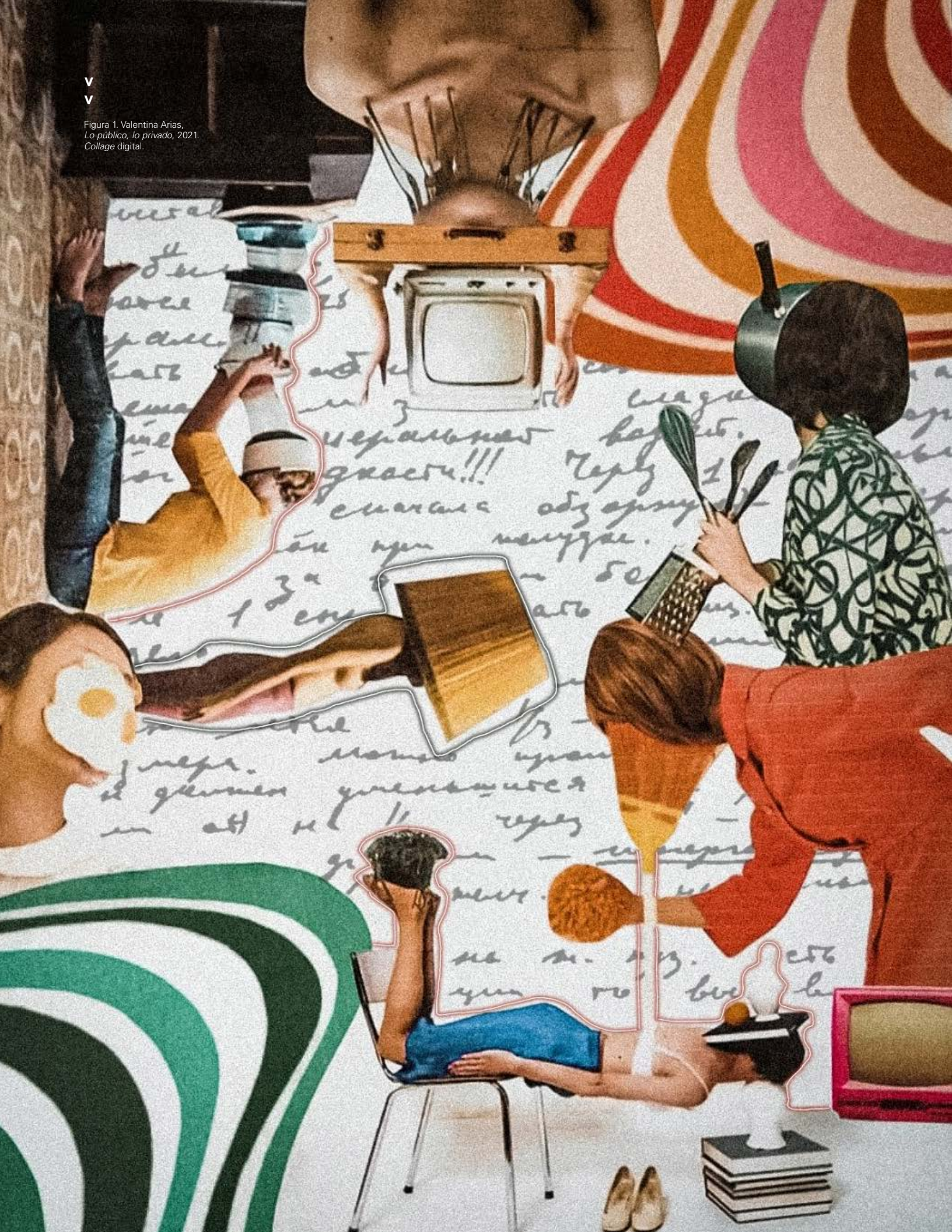
Figura 1. Valentina Arias, Lo público, lo privado , 2021. Collage digital.