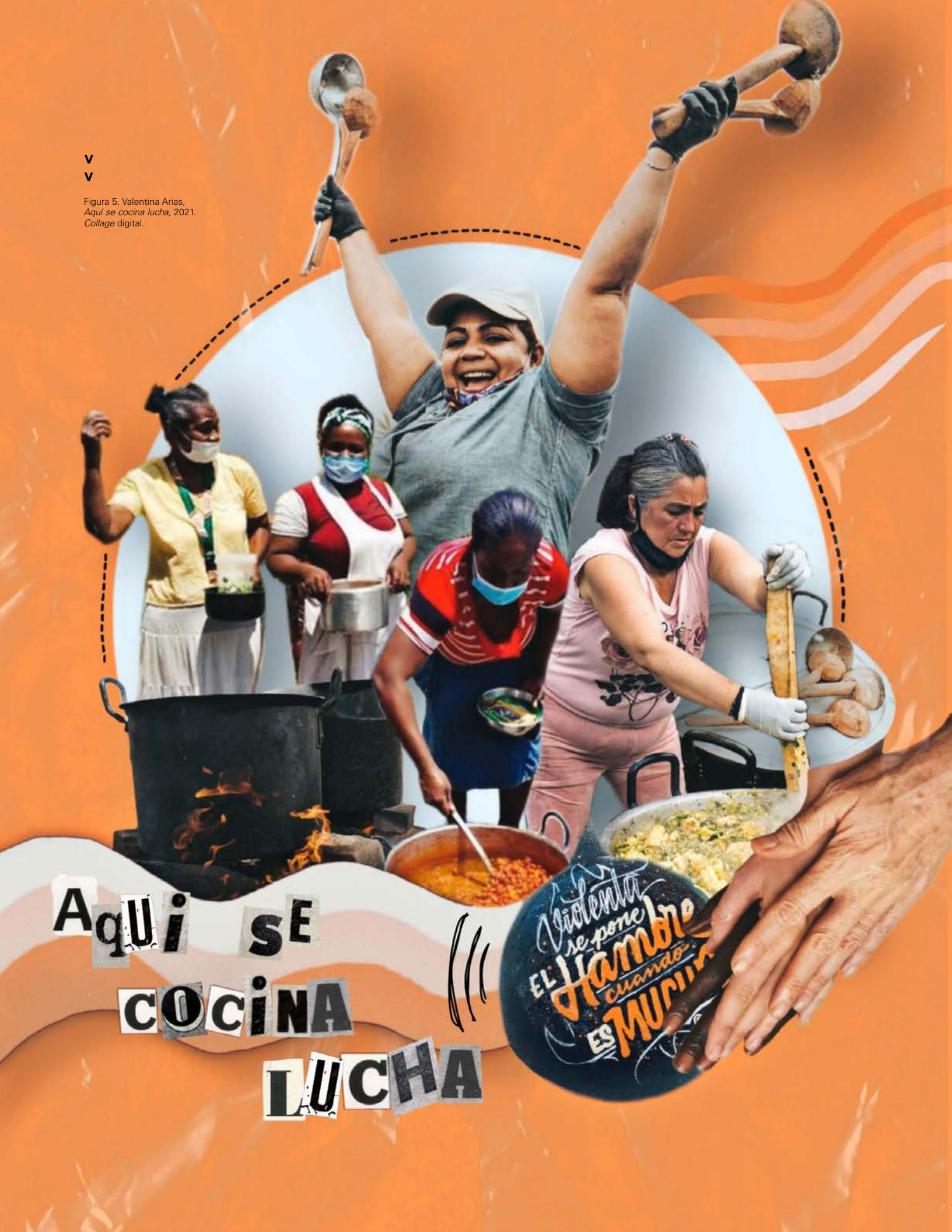
Figura 5. Valentina Arias, Aquí se cocina lucha , 2021. Collage digital.