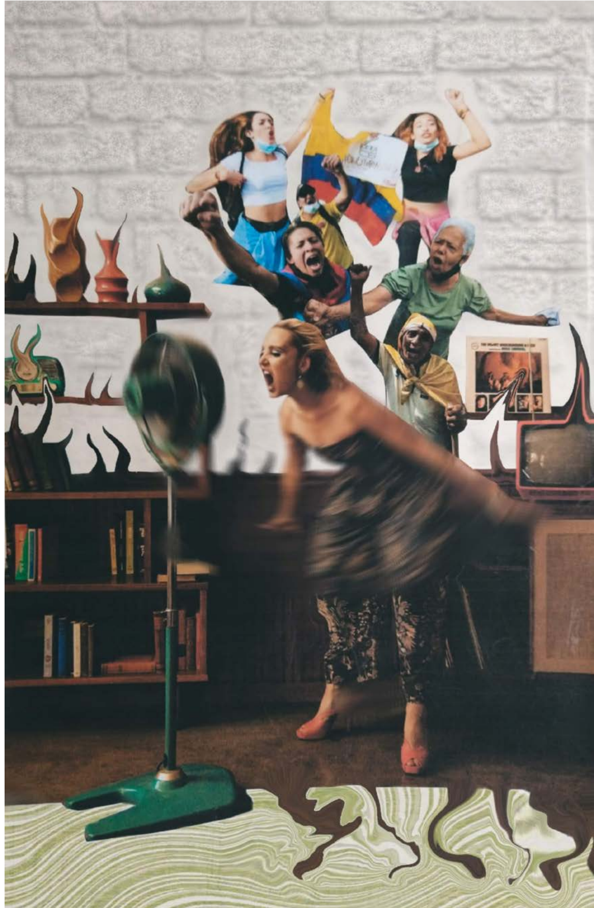
Figura 4. Valentina Arias, Hogar , 2021. Collage digital.