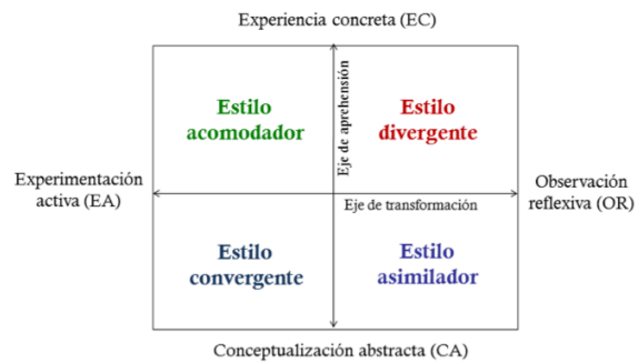
Figura 1. Modelo del aprendizaje basado en la experiencia según Kolb (1).

El aprendizaje efectivo requiere cuatro habilidades o modos de aprendizaje (EC, OR, CA y EA) que constituyen los polos de los dos ejes fundamentales del aprendizaje: el de aprehensión de la experiencia (continuo concreto-abstracto) y el de transformación de la experiencia (continuo acción-reflexión)