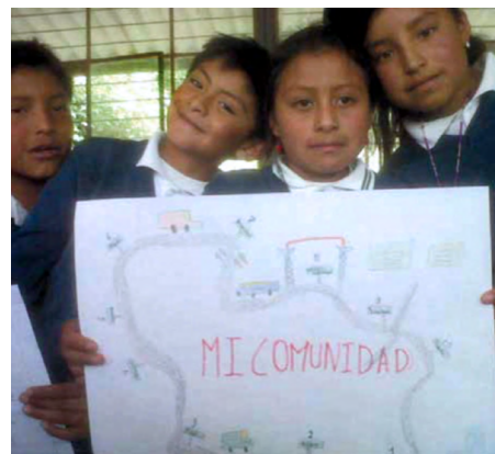
Figura 5 Trabajo identificando mi comunidad