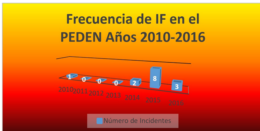
FIGURA 1. Frecuencia de incendios forestales en el Peden, años 2010-2016