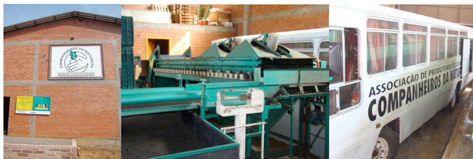
Figura 1. Casa de embalagem, esteira de limpeza e o ônibus da Associação Companheiros da Natureza

Esta estrutura da CN (Figura 1) tem contribuído para melhorar a qualidade da apresentação dos seus produtos. Ao mesmo tempo, tem facilitado as questões logísticas dos associados, pois a produção pode chegar qualquer dia na casa de embalagem . Isto permite que os associados se organizem e façam a colheita dos produtos que levará à feira em qualquer dia. Antes de terem a casa de embalagem , os associados da CN precisavam colher seus produtos nas vésperas de realização das feiras. Esta estrutura facilitou seus trabalhos e suas vidas, permitindo-lhes maior qualidade de vida, além de lhes possibilitar apresentarem produtos de aparência mais agradável, pois são mecanicamente lavados, escovados e selecionados por tamanho. Depois disto são embalados manualmente em sacolas tipo rede para 2 ou 5 kg.