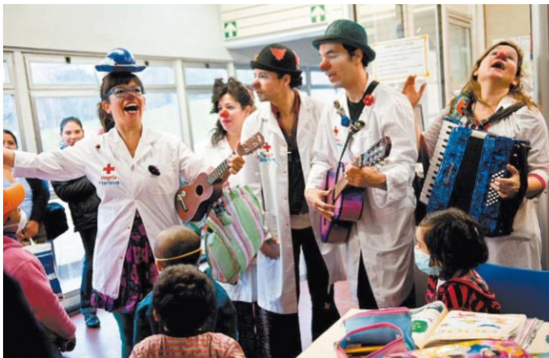
Fotografía 4. Uso del humor y la música en un Hospital Fundación la Capital. Risas que llevan alivio.

Gratitud ante la propia vida es la que ofrece el cantante José Carreras a través de las acciones de su fundación. En 1988, un año después de superar una leucemia, el tenor impulsó el nacimiento de la fundación que lleva su nombre, cuyo objetivo principal es el de luchar contra dicha enfermedad. Desde entonces, Carreras ha participado activamente en la gestión, organización y, sobre todo, captación de fondos a través de numerosos actos benéficos y musicales. Entre estos, destacan los recitales ofrecidos por todo el mundo en solitario o con otras figuras de renombre internacional. En cualquier caso, desde su centro en Barcelona y sus sedes en Alemania, Suiza y Seattle, José Carreras, gracias a sus actos y su ejemplo de gratitud a la vida que le ha permitido superar esa grave enfermedad, lucha firmemente por salvar las vidas de los afectados por esta enfermedad.