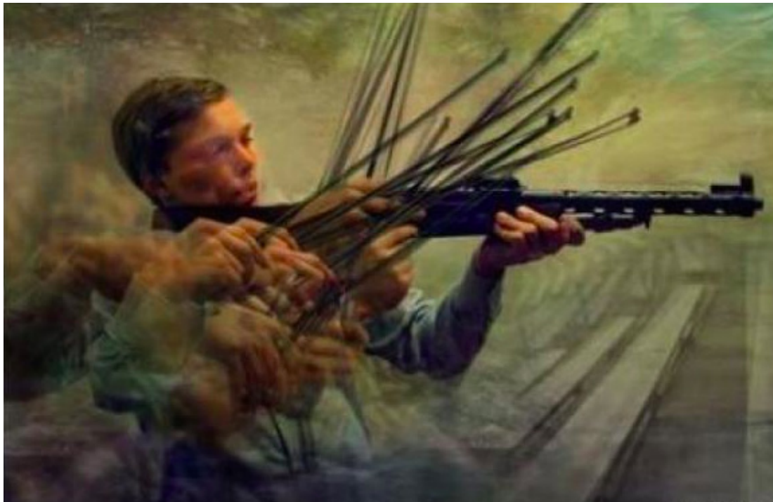
Fotografía 3. Representación artística del cambio de armas por instrumentos Paperwings. El sonido de un arma. Desmotivaciones.es. Página personal del artista, 2011.

los tradicionales concursos de música es que todo el proceso es televisado y retransmitido en horario de máxima audiencia. Esto hace que cualquier persona, en ese momento, se convierta en juez crítico desde su propia casa, por lo que los concursantes están sometidos a la máxima presión. Además de la autorregulación en el estudio para llegar hasta aquí, debemos subrayar que a cualquier concursante le puede llegar la fama de un día para otro, por lo que dicho autocontrol es esencial para poder seguir avanzando en su carrera musical.