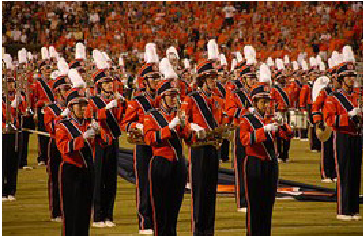
Fotografía 2. Marching band universitaria en una actuación Scott, Kerry. Marchin Band. Pixabay. Página personal del artista, 2014.

La vitalidad está asociada al sentimiento de entusiasmo , por y a causa de todo lo que se hace. Dicho entusiasmo es una apelación a todas las actividades que se realizan, convirtiéndose en un estilo vital que impregna el resto de conductas. La vitalidad es altamente valorada y admirada, y conlleva sentimientos de satisfacción y compromiso con los actos de la persona