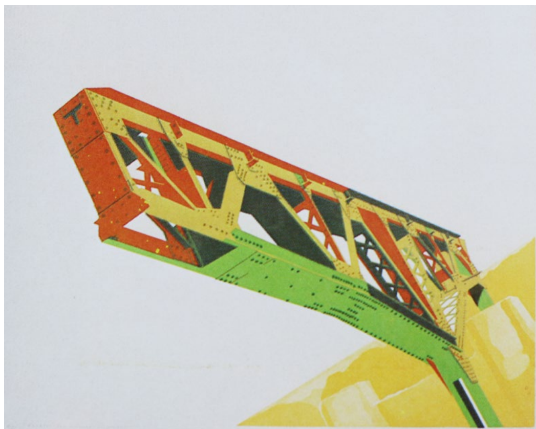
Figura 3. María Victoria Porras: Ramajes del hombre, su hierro III , 1971, litografía y aguatainta, 47 x 57 cm.

Sobre la expresión significación simbólica , articulada por Susan Buck-Morss a partir de sus lecturas sobre Walter Benjamin, se empleará para referirse a aquel tipo de representación que surge de la relación dialéctica y transitoria entre lo empírico y lo utópico, con un modo de interacción que anticipa efímeramente lo que podría llegar a ser una forma natural-humana