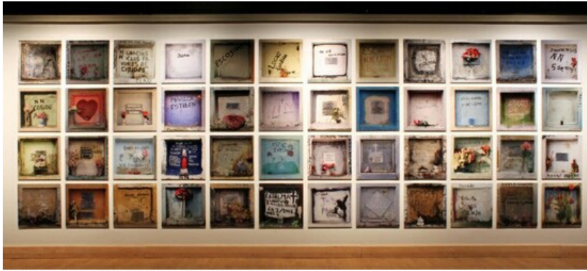
Figura 1. Montaje para exposición de fotografías lenticulares.