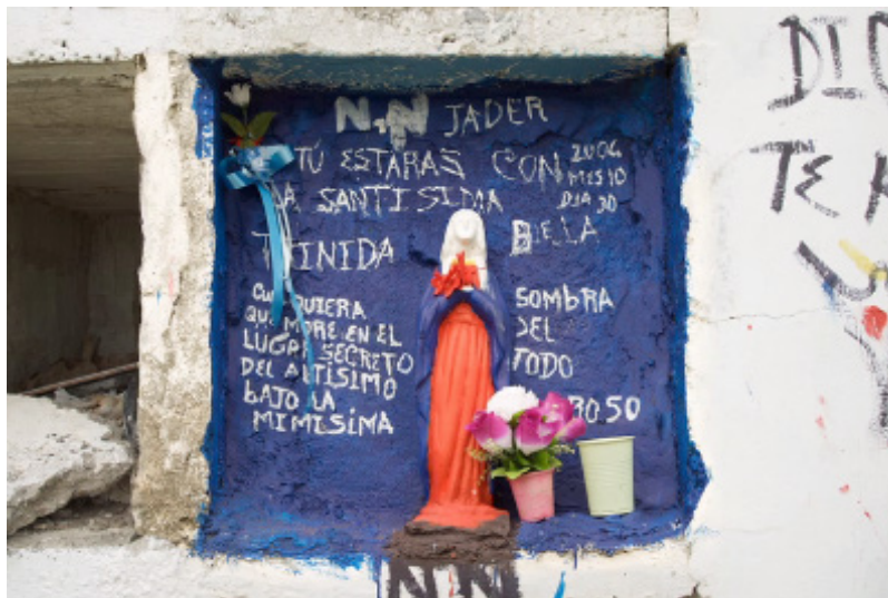
Figura 4A. Video, screenshot 1.