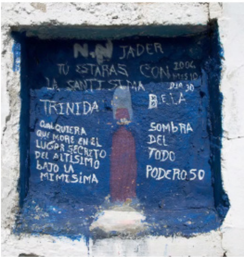
Figura 3B. Fragmento del montaje lenticular, screenshot 2.