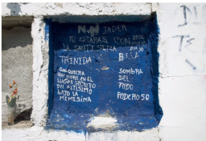
Figura 4C. Video, screenshot 3.