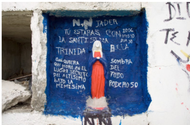
Figura 4B. Video, screenshot 2.