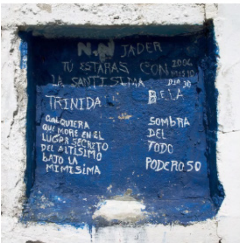
Figura 3C. Fragmento del montaje lenticular, screenshot 3.