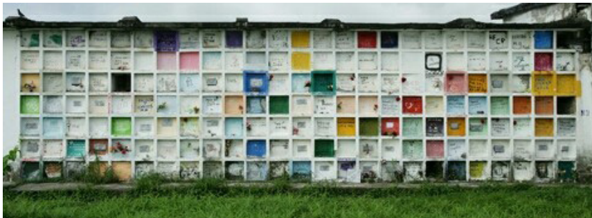
Figura 2. Nichos mortuorios en el cementerio de Puerto Berrío.

En ese sentido, la serie de videos Novenarios en espera no crea tal ilusión, pues muestra la transformación de los nichos de modo individual y deja ver algo del lugar en el que se dan dichas transformaciones. De hecho, podría pensarse, es una negación del montaje de las fotografías lenticulares. Una negación que se escapa de la propia intención de Echavarría, pues suele exponer Novenarios en espera y la galería de fotos simultáneamente, pero no de manera conflictiva o contradictoria, sino más bien complementaria. Si el montaje fotográfico elimina los elementos perturbadores del entorno, en la serie de videos aparecen datos que enturbian lo que las fotografías depuran.