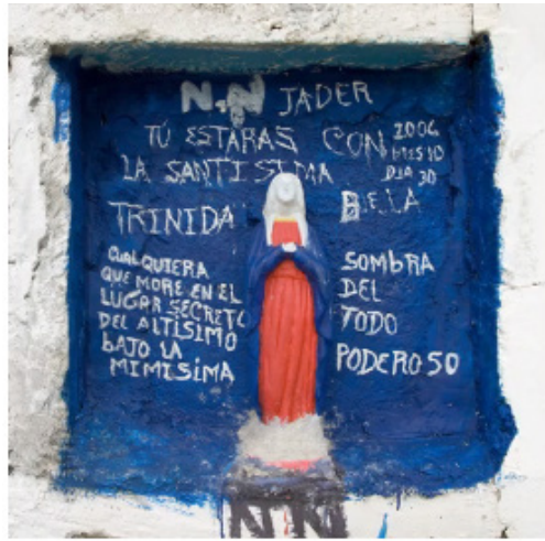
Figura 3A. Fragmento del montaje lenticular, screenshot 1.