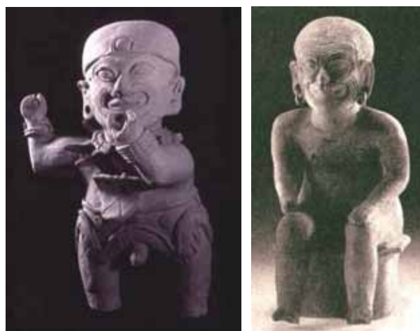
Figura 10: Cabeza y cola de serie: 1. Personaje de alto rango . Estatuilla hueca y 2. El dios viejo . Estatua hueca (37 cm) Esmeraldas oriental.

La figura del dios viejo (a diferencia, por ejemplo, de la vieja desdentada) está sentado en un sillar, tiene una expresión de sonrisa, que se combina con las representaciones de las arrugas del rostro. La posición del cuerpo se desvía de rasgos típicos como parado, recto e inexpresivo. Todo parece indicar, en este caso, que los rasgos anómalos son expresión de la superioridad del sujeto representado.