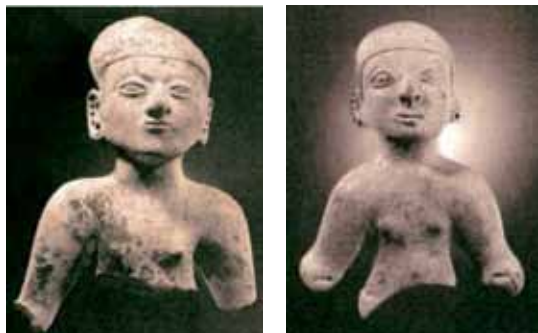
Figura 2: Jovencitas , ocarinas. Halladas rotas.

Muchas de las esculturillas que representan jovencitas y efebos son ocarinas, algunas pocas han sido halladas enteras y la mayor parte han sido encontradas rotas. Al parecer, fueron objeto de sacrificios sustitutivos (en un sacrificio o rito sustitutivo, un sujeto es reemplazado por una representación o simulacro, a este último le son realizadas todas las operaciones que le corresponderían al sujeto) Ver figura 2.