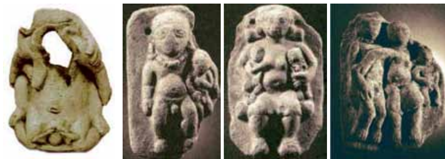
Figura 18: Serie de familia: 1. Parto asistido, 2. Madre con gemelos, Padre con un hijo varón y 3. Pareja con hijo.

Después de las parejas, la serie de la sexualidad no tiene término masculino, todo se resuelve en el cuerpo de la mujer, ya que corresponde al parto (ver figura 18).