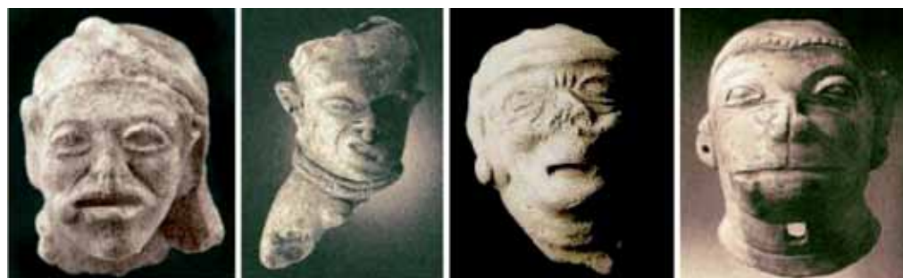
Figura 24: Serie deformidad: 1. Cabeza masculina, 2. Hombre con parálisis facial, 3. Cabeza con patología y 4. Cabeza simiesca.

El comienzo de esta serie (ver figura 24) es una cabeza muy parecida a la típica, que presenta un defecto leve al lado de la boca y, además, una expresión un poco fuerte. El paso dos es una cabeza con un fragmento de hombro que representa un hombre con parálisis facial, con una expresión que lo hace parecer incómodo. Su rostro, además, ha perdido totalmente el rasgo típico de simetría. El paso tres es la representación de una cabeza de un anciano con un grupo de defectos tan pronunciados que pierde por completo la simetría y, además, presenta una expresión muy visible gracias a las arrugas. La serie termina con una cabeza que mantiene la simetría, pero presenta rasgos simiescos, que se alejan de lo humano.