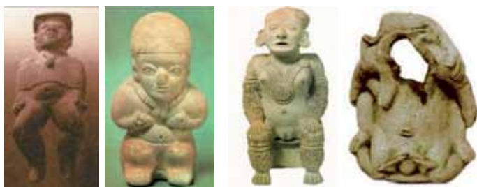
Figura 16: Serie sexualidad femenina: 1. Jovencita preparada para un ritual, 2. Mujer que exhibe sus senos, 3. Mujer sentada y 4. Parto asistido.

En la serie de la sexualidad (ver figura 15), es muy probable que las representaciones de falos en erección consistieran en hierofanías de poder religioso más que de eventos de sexualidad cotidiana. Lo masculino se sale del evento sexual (cotidiano) en dirección a convertirse en atributo o signo de poder (figura 2. Remero fálico ); luego, se separa del cuerpo como un objeto independiente (figura 3. Falo ). En el término siguiente, el falo vuelve a ser parte de un cuerpo de hombre-jaguar (figura 4. Figura de jaguar con genitales humanos ). El falo se convierte en atributo de la hierofanía que se manifiesta en el jaguar, poder y fuerza de un mundo más verdadero que el cotidiano.