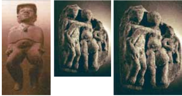
Figura 12: Cabeza y cola de serie: 1 y 2. Jovencita preparada para un ritual (15,5 cm). Estatuilla hueca, La Tolita; Joven preparado para un ritual de iniciación (16,1 cm). Medallón, La Tolita y 3. Pareja con hijo varón (11,5 cm). Medallón, La Tolita.

En la serie de la sexualidad, se hace necesario tener en cuenta un término medio: el alumbramiento, pues, en este, se manifiesta el carácter sagrado del acoplamiento de los cuerpos y también la capacidad que los seres humanos tienen de imitar el acto creador de los dioses (la creación de estatuas sería la imitación menor). El Parto asistido que ocupa el lugar central de la serie (ver figura 13) plantea el misterio de la maternidad, manifestación de la fertilidad del mundo, una hierofanía mayor. Según Mircea Eliade, los mitos y ritos sobre la fecundidad y riqueza del mundo se refieren a la figura de la tierra-madre. Esta imagen divina contiene la multiplicidad de aspectos de la fertilidad universal. El momento del parto es una manifestación del misterio de la vida misma. Eliade dice que “la aparición de la vida es, para el hombre religioso, el misterio central del mundo” (1992, p. 127).