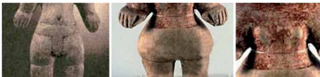
Figura 3: Detalle de Efebo y detalles de Jovencita . La Tolita.

La serie de jóvenes presenta rasgos sexuales diferenciados para hombres y mujeres. Con frecuencia, en los hombres, son visibles los genitales, y en las piezas que no son visibles estos están cubiertos por una prenda que remarca la región genital. Las mujeres, en todos los casos, tienen una cintura marcada, caderas anchas, llevan una prenda que oculta sus genitales (a manera de falda) y son notorios en su torso los senos abultados (ver figura 3).