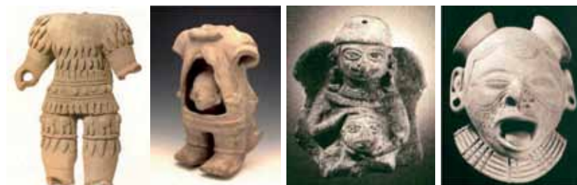
Figura 20: Serie separación cuerpo-cabeza: 1. Cuerpo de guerrero emplumado , 2. Cuerpo con cabeza-huésped , 3. Personaje con cabeza-trofeo y 4. Cabeza-trofeo .

El final de la serie lo constituyen las cabezas-trofeo (ver figura 20), que son en su totalidad objetos para portar, colgados al cuello, como atributo. Las cabezas-trofeo fueron realizadas como piezas independientes y muy posiblemente representaron cabezas reales de enemigos vencidos, que eran preparadas (por ejemplo, reducidas) para ser portadas. Las cabezas-trofeo de cerámica parecen ser sustitutos de cabezas reales, pero mantienen rasgos de estas, como los ojos cerrados del muerto o (como en la cabeza que mostramos como ejemplo) expresiones dadas al momento de procesarlas (boca abierta).