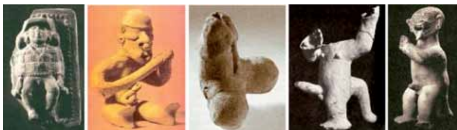
Figura 15: Serie sexualidad masculina: 1. Joven preparado para un ritual de iniciación, 2. Remero fálico, 3. Falo, 4. Figura de jaguar con genitales humanos, 5. Hombre-jaguar.

La Colección de falos mostrada arriba hace evidente que estos provienen de mutilaciones efectuadas a esculturas (muchas de ellas destruidas). En la estatuilla Guerrero que le sigue, podemos apreciar cómo le ha sido arrancado el falo (por guaqueros o por accidente). En las dos figuras siguientes, vemos que el falo sobresale como un atributo que acompaña actividades no relacionadas con la sexualidad de la pareja.