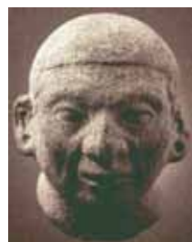
Figura 21: Cabeza.

Esta autonomía final de la figura de la cabeza con respecto a un cuerpo sugiere la posibilidad de desarrollar otras series derivadas que tengan como comienzo de serie cabezas típicas y sigan (como hemos hecho con el cuerpo) variaciones anómalas. Tomaremos como cabeza típica la que más se acerque a los rasgos de simétrica, inexpresiva y sana (ver figura 21).