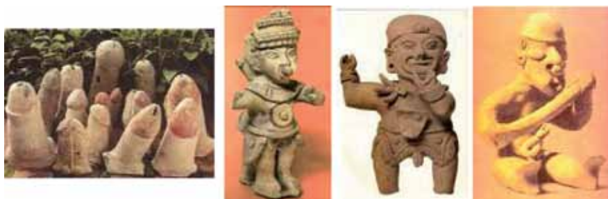
Figura 14: Serie falo: 1. Colección de falos, 2. Guerrero, 3. Guerrero y 4. Remero fálico.

piezas tulatas, se encuentra muy ubicada en el falo, pero, más que manifestar un estado erótico (entendido como disposición del cuerpo para el evento sexual), parece dirigirse a la relación entre la fuerza sexual como un atributo de poder.