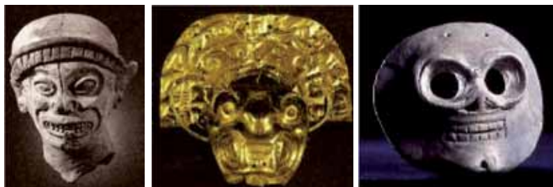
Figura 25: Serie mueca olmeca: 1. Cabeza de hombre-jaguar y 2. Cabeza de dios-jaguar con diadema; 3. Máscara de calavera.

Hay una serie de cabezas tulas que presentan la “mueca olmeca” 14 (ver figura 25) o rasgo de mostrar los dientes. Presentan pasos graduales que van en direcciones distintas: unas se dirigen hacia el jaguar y otras hacia la calavera.