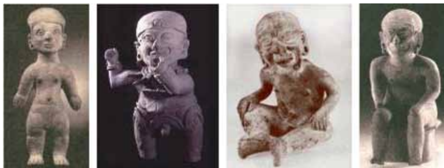
Figura 11: Serie edad de los hombres: 1. Efebo, 2. Personaje de alto rango, 3. Viejo y 4. El dios viejo.

En la serie de figuras de hombres, la edad no parece representar una pérdida sino un incremento (de experiencia, sabiduría, poder) y su estado final es la expresión de una hierofanía mayor (el cuerpo de un dios). Ver figura 11.