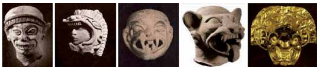
Figura 26: Serie mueca olmeca-jaguar: 1. Cabeza de hombre-jaguar, 2. Cabeza con máscara de jaguar, 3. Cabeza-máscara de jaguar, 4. Cabeza felina y 5. Cabeza de dios jaguar con diadema.

Los pasos de cada serie expresan grados de alejamiento de la experiencia sensitiva corporal y de acercamiento a estados de percepción extática (ver figura 26). La primera bifurcación de la serie se dirige a la cabeza-jaguar de oro, los pasos consisten en la gradual desaparición de la estructura humana en los rasgos crecientes del dios-jaguar. El paso dos es la representación de una cabeza humana decapitada, cubierta parcialmente por una máscara-yelmo con rasgos de jaguar. El personaje se mantiene completamente humano y realiza cierto simulacro a través atributo. El paso tres combina rasgos humanos con rasgos de jaguar, hay una especie de hibridación en la que la estructura craneana se mantiene en lo humano y los gestos de boca con colmillos y ojos levemente rasgados la conducen a la expresión de jaguar. El paso cuatro es una cabeza decapitada en la que sobresale bastante el hocico y los colmillos, los ojos y las orejas son completamente felinos y se mantiene la relación con lo humano solamente en la raíz del cuello.