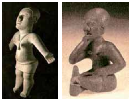
Figura 8: Cabeza y cola de serie: 1. Figura de mujer (12 cm), estatuilla hueca y 2. Vieja desdentada (19 cm), estatuilla hueca, Nariño.

Teniendo en cuenta que el término inicial de las series es el cuerpo típico de los jóvenes, la cabeza de esta serie es la mujer adulta. La Figura de mujer (figura 8) mantiene la posición del cuerpo típico y se diferencia de este en que sus rasgos faciales son más fuertes, lleva un objeto colgado de un collar y su vientre es protuberante. Las representaciones de mujer adulta pasan por diferentes roles como la maternidad, el amamantamiento, el cuidado de los hijos y, algunas veces, de autoridad (las veremos en otras series). La figura de cierre de la serie es la mujer anciana, la Vieja desdentada que expresa la posición final. En la serie propuesta, no presenta casi ninguno de los rasgos del cuerpo típico (completo, parado, recto, simétrico, inexpresivo y sano). Aún en el caso del rasgo de sano, parece que la posición del brazo que toca la cara y la expresión de sufrimiento quisieran señalar cierto estado no saludable; tampoco el rasgo de completo, por el hecho de que su boca abierta deje ver que solo le quedan dos dientes.