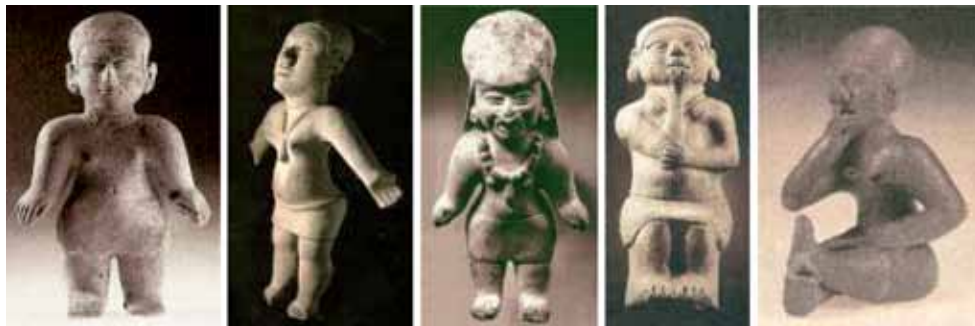
Figura 9: Serie edad de las mujeres: 1. Jovencita , 2. Mujer , 3. Mujer melenuda , 4. Pensadora y 5. Vieja desdentada .

El contraste de estas dos figuras, el que hay entre adultez y vejez, consiste en la pérdida de la plenitud, la irrupción del sufrimiento y el cansancio (Ver figura 9).