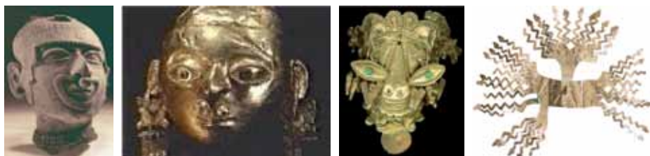
Figura 23: Serie atributos de cabeza: 1. Cabeza masculina, 2. Cabeza de oro, 3. Máscara de oro y 4. Máscara solar.

La serie comienza con una cabeza típica desprendida (por decapitación sustitutiva) que tiene los atributos de nariguera (ver figura 23), tocado sencillo de cabeza y gargantilla, rasgos que nos permiten colegir que se trata de un personaje de rango.