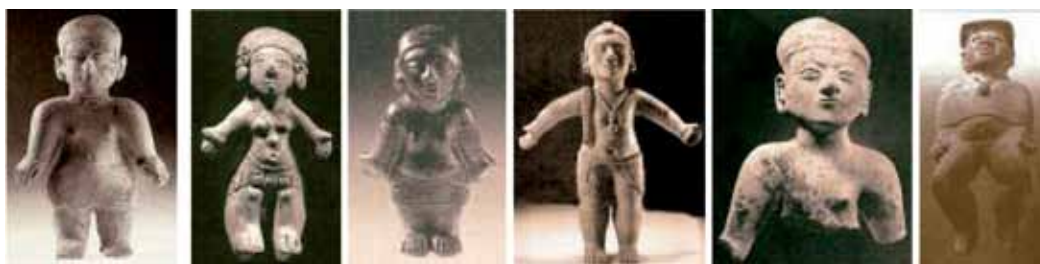
Figura 5: Serie jovencitas: 1. Jovencita, 2. Jovencita ataviada, 3. Jovencita ataviada, 4. Venus del Morro, 5. Busto de jovencita y 6. Jovencita preparada para un ritual.

La serie que planteamos comienza con la jovencita típica sin atavíos, sigue en los pasos 2, 3 y 4 con la presencia de atavíos y mantiene los rasgos típicos. El paso 5 muestra una jovencita rota en un sacrificio sustitutivo y termina con la joven preparada para un ritual.