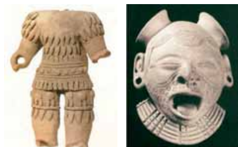
Figura 19: Cabeza y cola de serie: 1. Cuerpo de guerrero emplumado . Esculturilla hueca y 2. Cabeza-trofeo . Simulacro para colgar.

Los tultatos realizaron otros sacrificios sustitutivos con figuras de jovencitas y efebos, pero estos fueron rotos a la altura de la cadera o el tórax. Los cuerpos decapitados tienen atributos de rango, varios de ellos son guerreros emplumados. En todos los casos, esto puede indicar que la sustitución significaba una especie de ahorro de vidas humanas útiles para la sociedad tultata (ver figura 19).