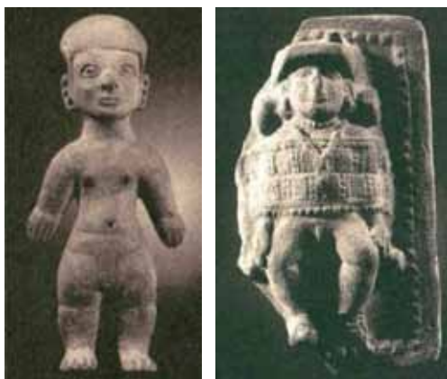
Figura 6: Cabeza y cola de serie: 1. Efebo (16 cm.). Estatuilla hueca, La Tolita y 2. Joven preparado para un ritual de iniciación (16,1 cm.). Medallón, La Tolita.

Los efebos también presentan los rasgos típicos, anteriormente señalados, más rasgos de especificación sexual como una protuberancia menor en los senos, cintura menos marcada y cierta volumetría que marca la forma de los genitales (Ver figura 6).