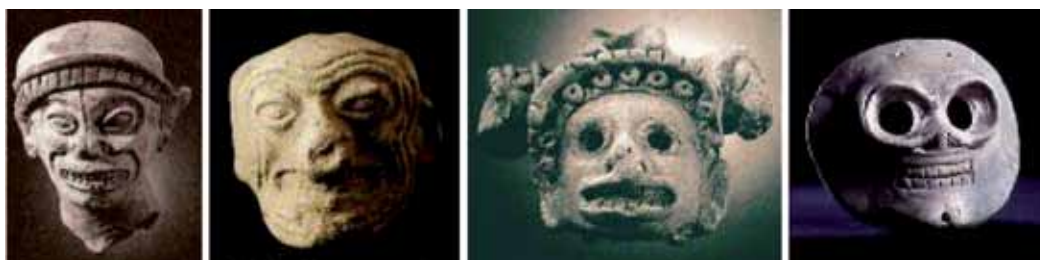
Figura 27: Serie mueca olmeca-calavera: 1. Cabeza de hombre-jaguar, 2. Máscara de anciano, 3. Máscara de muerto y 4. Máscara de calavera.

El paso final de la serie es una máscara de calavera (figura 27), con las cuencas de los ojos vacías, la mueca totalmente rígida en los dientes y las fosas nasales completamente despejadas. La calavera no pierde nunca la estructura humana (es la estructura de los rostros humanos), lo que pierde por completo es la posibilidad de gestualidad. La calavera tulata es un ser, solo que de otro tipo. La serie de calavera pierde paulatinamente la posibilidad de expresión y la movilidad termina en pura estructura inmóvil, sólida, es el afuera inferior del mundo cotidiano: el mundo de los muertos. La serie mostrar los dientes conduce a los dos extremos de la experiencia vital: su afuera superior, gestual, expresivo y desestructurado, ligado a la luz del sol y el poder del jaguar, y su afuera inferior, rígido, inexpressivo y completamente estructurado, ligado a la solidez de la materia dura y el carácter de gesto definitivo con que aparece, ante nuestra experiencia, la imagen de la muerte.