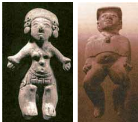
Figura 4: Cabeza y cola de serie: 1. Jovencita ataviada (19,2 cm). Estatuilla hueca, La Tolita y 2. Jovencita preparada para un ritual (15,5 cm). Estatuilla hueca, La Tolita.

Las jovencitas que hemos visto hasta ahora manifiestan los rasgos típicos de los que hablamos al comienzo del capítulo (un cuerpo completo, parado, recto, simétrico, inexpresivo y sano) más una diferenciación sexual estandarizada. La anomalía que seguiremos en la primera serie comienza con la presencia de atavíos en el cuerpo y finaliza con la figura de ritual de iniciación a la sexualidad. Esta serie nos permite acercarnos a una visión de los roles asignados por la sociedad tulata a las mujeres jóvenes (ver figura 4).