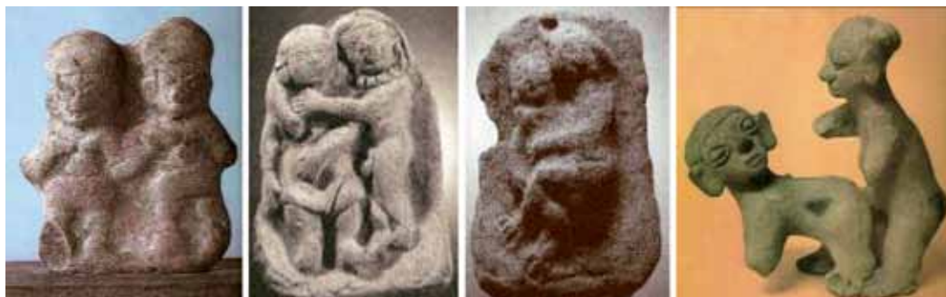
Figura 17: Serie de parejas: 1. Pareja y 2, 3 y 4. Parejas en cópula.

Antes del término del parto, la serie de la sexualidad pasa por una serie de figuras de reunión de lo masculino y lo femenino en la pareja (ver figura 17). El primer término es una pareja con expresiones afecto (figura 1) y los siguientes términos son parejas eróticas, en unión sexual explícita que pasa del acariciamiento al acoplamiento (recuadros 4, 5 y 6). Sobre la unión sexual de la pareja, Bataille dice que, aunque al hombre le corresponde la parte activa y a la mujer la parte pasiva, se trata de llegar juntos al punto de disolución de las formas constituidas, de "introducir al interior del mundo toda la continuidad de la que este mundo es capaz" (2002, p. 23) en una acción recíproca de los amantes.