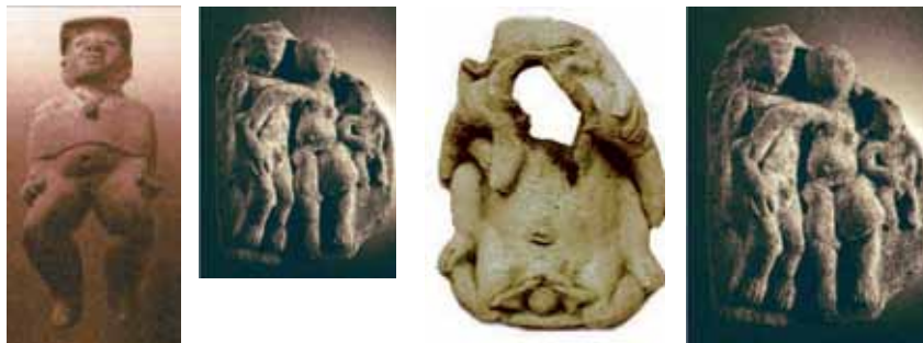
Figura 13: Serie procreación: 1 y 2. Jovencita preparada para un ritual (15,5 cm). Estatuilla hueca, La Tolita; Joven preparado para un ritual de iniciación (16,1 cm). Medallón, La Tolita; 3. Parto asistido y 4. Pareja con hijo varón (11,5 cm). Medallón, La Tolita.

En la serie de la sexualidad, se hace necesario tener en cuenta un término medio: el alumbramiento, pues, en este, se manifiesta el carácter sagrado del acoplamiento de los cuerpos y también la capacidad que los seres humanos tienen de imitar el acto creador de los dioses (la creación de estatuas sería la imitación menor). El Parto asistido que ocupa el lugar central de la serie (ver figura 13) plantea el misterio de la maternidad, manifestación de la fertilidad del mundo, una hierofanía mayor. Según Mircea Eliade, los mitos y ritos sobre la fecundidad y riqueza del mundo se refieren a la figura de la tierra-madre. Esta imagen divina contiene la multiplicidad de aspectos de la fertilidad universal. El momento del parto es una manifestación del misterio de la vida misma. Eliade dice que “la aparición de la vida es, para el hombre religioso, el misterio central del mundo” (1992, p. 127).