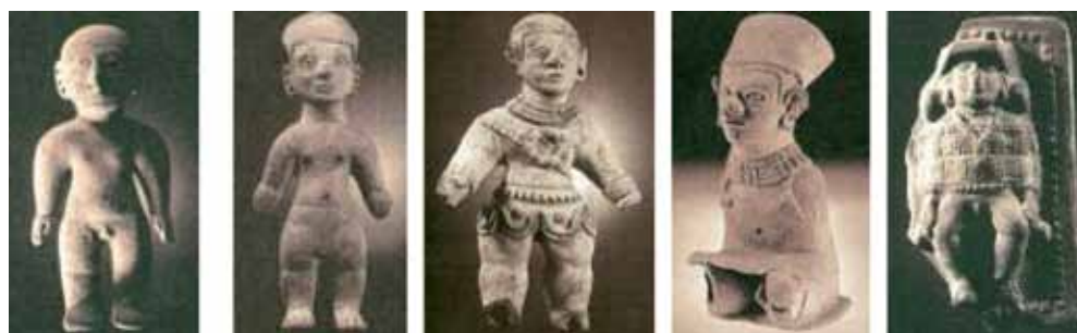
Figura 7: Serie efebos: 1. Efebo (desnudo), 2. Efebo (con taparrabo), 3. Joven guerrero, 4. Efebo sentado y 5. Joven preparado para un ritual de iniciación.

coleccionado y exhibido), posiblemente se trató también de un sustituto sacrificial al igual que las jovencitas. El taparrabo que lleva puesto es un indicio probable de que los tulatos ocultaran, como muchos pueblos, la sexualidad para la intimidad 8 . El final de la serie es un efebo (su pene aún no ha llegado a la madurez) ataviado y atado para algún tipo de práctica ritual que no era del todo voluntaria o en la que el participante tomaba la actitud de víctima (ya que se encuentra atado). La exhibición del sexo inmaduro y en estado no erecto y la posición de piernas abiertas hacen pensar que el papel es aceptado con cierto grado de voluntariedad y que tiene que ver con el comienzo de la sexualidad (probablemente una circuncisión) pero no con una escena explícitamente sexual. La esculiturilla es un medallón, por lo cual es muy probablemente que su uso haya sido el de exvoto; luego, no se trataría tampoco de una representación sustitutiva, sino más bien la evocación de un evento (Ver figura 7).