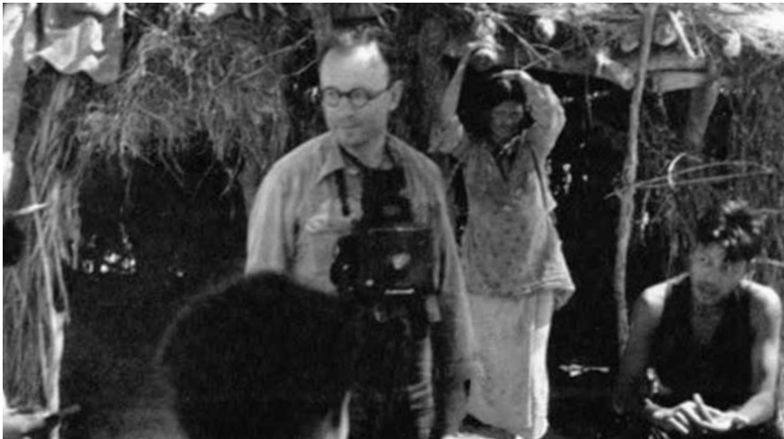
Ilustración 5 MÉTRAUX EN SOMBRERO NEGRO. Chaco formoseño (1939). Fuente: Krebs (44).

Como siempre en los estudios sobre la alteridad cultural, el objeto de análisis está inserto en una relación especular con la perspectiva del observador, y por lo tanto involucra un marco comparativo en el que la propia cultura resulta observada de modo indirecto y simultáneo al análisis de la cultura otra. Tanto Sur como el Collège de Sociologie funcionaron como redes de apoyo y estructuras que permitieron canalizar el intercambio intelectual hoy recuperable a través de un soporte que ya está en vías de desaparición: los epistolarios, que sirven para rastrear, además de las obras y los artículos escritos por el antropólogo suizo, las dificultades, las frustraciones, los proyectos y los anhelos que atraviesan su vida y su producción intelectual. En la ilustración 5 lo vemos con su cámara fotográfica en Sombrero Negro, Chaco formoseño, en 1939.