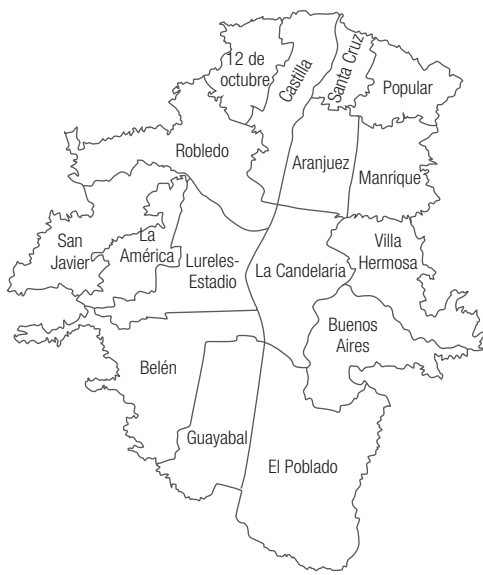
Figura 1. Comunas de Medellín

La estructura urbana de la ciudad, dividida en dieciséis comunas, es heterogénea y está conformada por viviendas unifamiliares, bifamiliares y trifamiliares, sobre todo en las zonas menos favorecidas; los estratos medios y altos comienzan a predominar las viviendas multifamiliares.