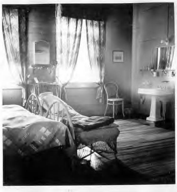
Figura 6. Interior de la Casa Grande de la finca La Violeta