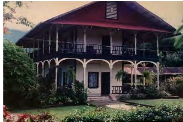
Figura 7. Casa Grande de la finca Alianza

social y ratifican el estatus de las familias (Zárate Toscano, 2005, p. 325) frente a los demás (figura 7).