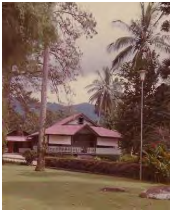
Figura 5. Casa Grande de la finca Argovia

Grande, como se suele denominar al edificio en el que habitan el patrón y su familia, constituye un hito referencial dentro del espacio habitado. Sus características arquitectónicas la singularizan y la diferencian de otras fincas del Estado. Es un espacio exclusivo y reservado para el finquero y su familia. Suele estar rodeado por una valla o jardín, como una manera de marcar las diferencias y distancia entre el espacio de los propietarios y el de los trabajadores (Ponce de Alcocer, 2010, p. 67). La botánica exuberante, e incluso exótica, suele adornar el espacio circundante que rodea el edificio, frecuentemente se ven palmeras —más propias de la costa que de la zona montañosa en la que se encuentran las fincas— y relacionadas con el gusto europeo por los huertos y jardines (figura 5).