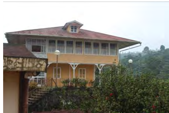
Figura 2. Vista lateral de la Casa Grande de la finca Hamburgo

El centro del espacio habitado está ocupado por la casa grande del propietario, las oficinas de la administración, así como la vivienda del administrador. Según las fincas analizadas, estos edificios pueden ubicarse cercanos entre sí, y formando un núcleo definido, como en la finca Irlanda, Hamburgo y Alianza (figura 2). En estas tres fincas los edificios se encuentran visibles a los ojos del visitante, ya sea encontrándolos según se accede a la finca o destacando por estar ubicados en un espacio elevado, desde donde se tiene un claro control visual de territorio.