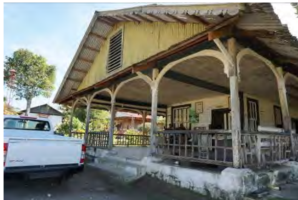
Figura 4. Oficinas administrativas de la finca Alianza

(Castillo, 2002, p. 207). La organización de la finca, un lugar desde su formación claramente estructurado, ya sea por necesidad o por interés, tuvo la finalidad de controlar este conglomerado de gente que proviene de parajes diversos marcados por las formas dispersas de vivir y que resultaban poco controlables.