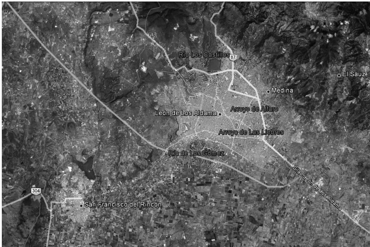
Figura 2 Aerofoto de León