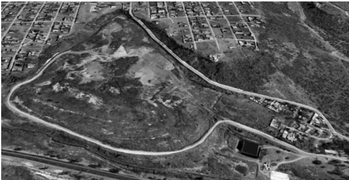
Figura 9 Relleno sanitario en la periferia de León, Guanajuato

Pero si la basura se separa en orgánica (desechos de comida, cartón/revistas y trapos) e inorgánica (metal/aluminio, vidrio, plásticos/unicel y los altamente tóxicos como llantas y pilas/baterías) y a cada una se le da un tratamiento específico, como triturarlos y compactarlos separadamente 13 para luego verterlos en este relleno sanitario (figura 9) y ahí volverlos a compactar con aplanadoras, esto reduciría el elevado porcentaje de vacío que tiene la basura y aumentaría la capacidad de relleno sanitario. Es decir, del ejemplo anterior, si estos