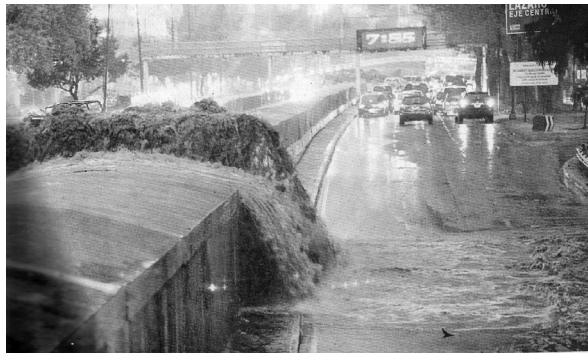
Figura 5 Desborde de colectores en León