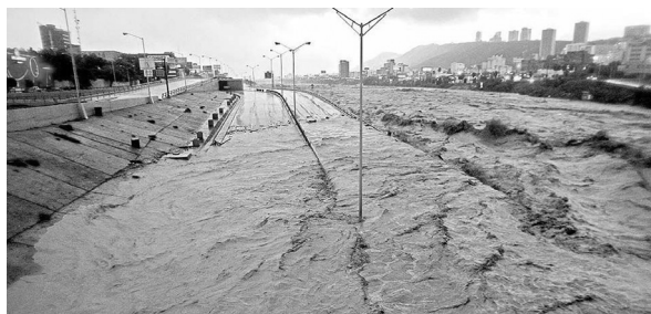
Figura 6 Crecida del río después de una tormenta