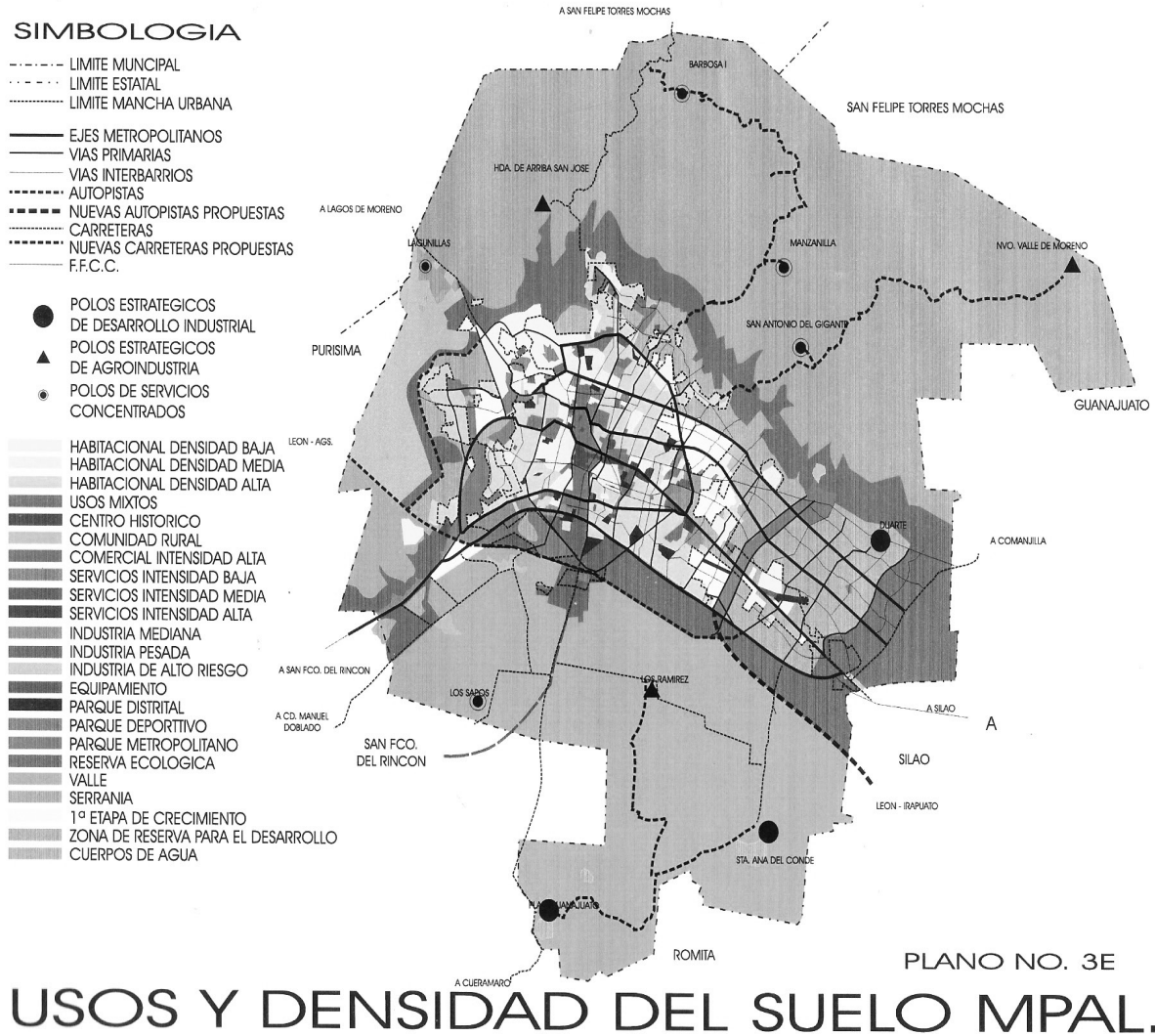
Figura 3 León: usos del suelo municipal