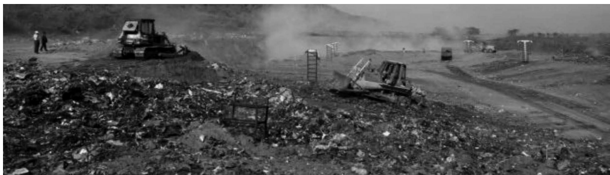
Figura 8 Compactación sin control de calidad

Usualmente estos volúmenes de basura se vierten en rellenos sanitarios (hondonadas o depresiones topográficas, cráteres de volcanes extintos o minas de arena en desuso). En ocasiones se utilizan