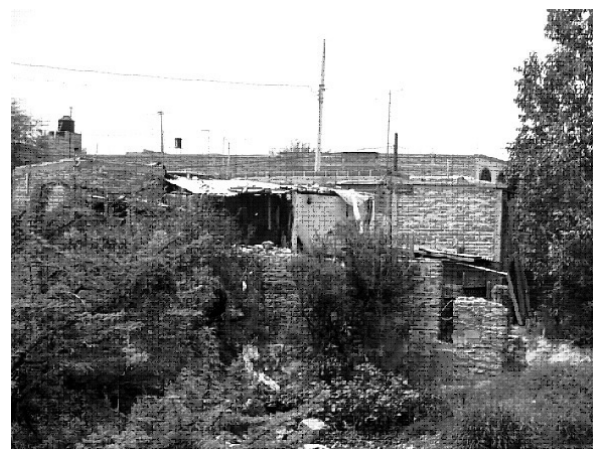
Figura 7 Vertido de desechos a cielo abierto