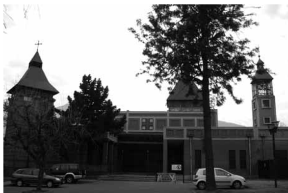
Iglesia del sector