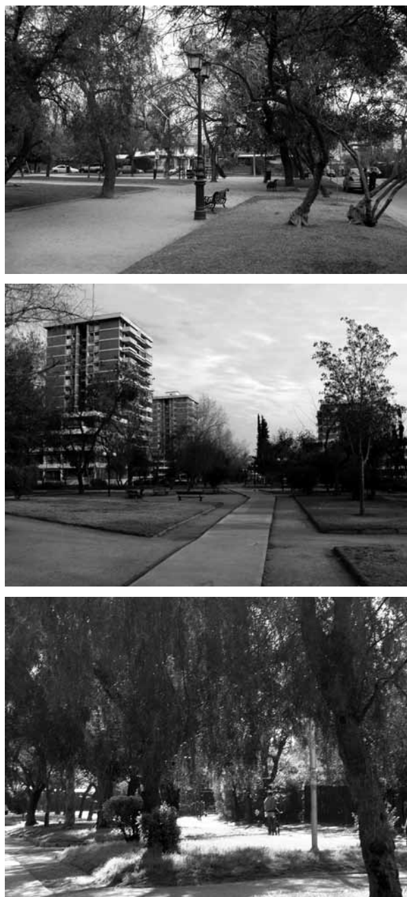
Figura 16 Diferenciación de escala en áreas verdes