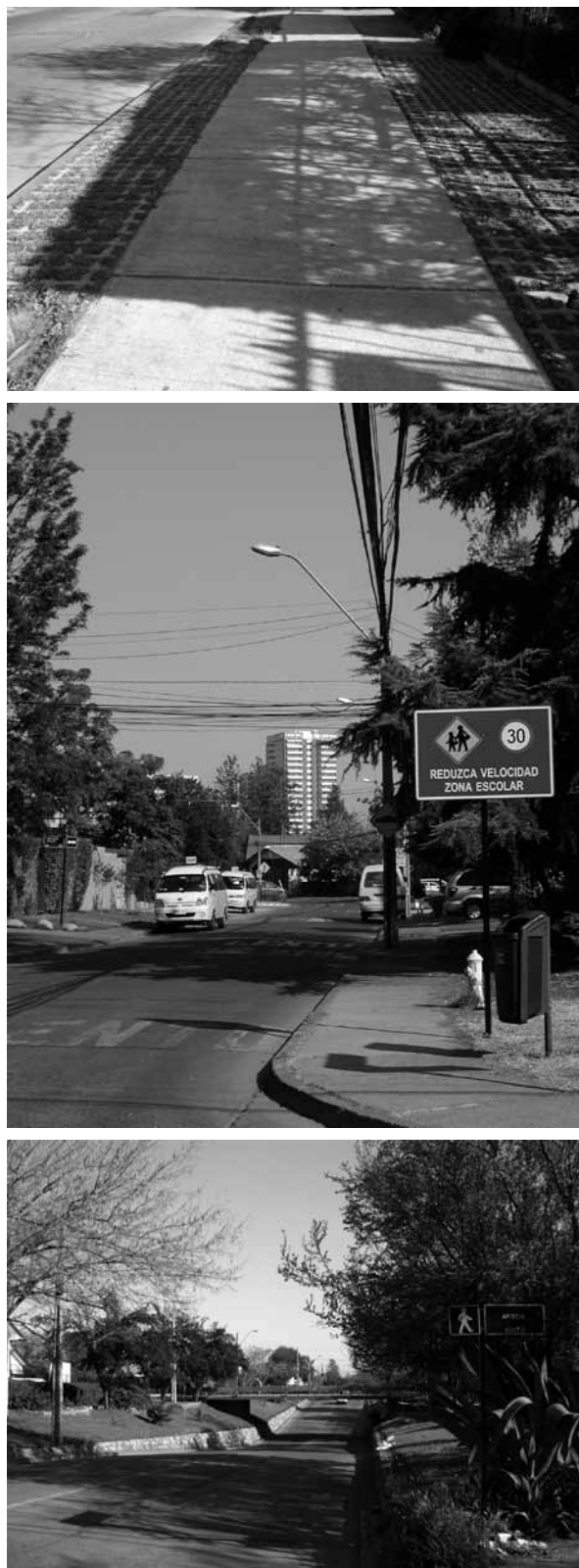
Figura 21 Condiciones para la circulación peatonal