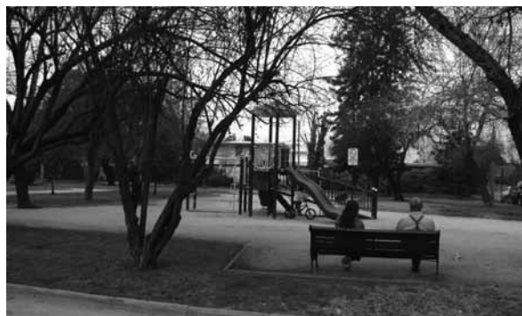
Espacios públicos: áreas verdes