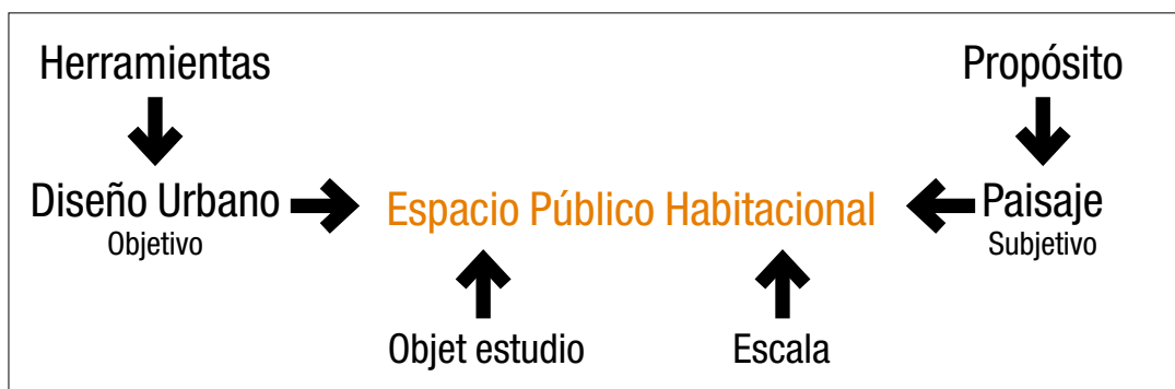
Figura 1 Relación de conceptos para la construcción del paisaje habitacional

Un ejemplo de ello se observa en la presencia de elementos naturales en el espacio urbano, la cual constituye una característica muy valorada del