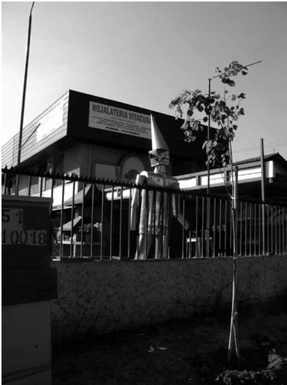
Figura 17 Cambio en usos del suelo