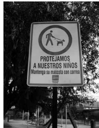
Figura 11 Uso y organización en los espacios públicos

De acuerdo con lo expuesto, el análisis integral de los indicadores establecidos para medir esta variable mostró cómo inciden en la actual imagen del sector habitacional en estudio aspectos relacionados con el diseño urbano, la gestión