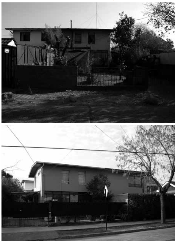
Figura 20 Metamorfosis de las unidades habitacionales: ejemplo caso Villa El Dorado