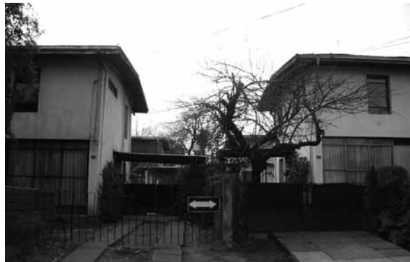
Tipología constructiva viviendas unifamiliares