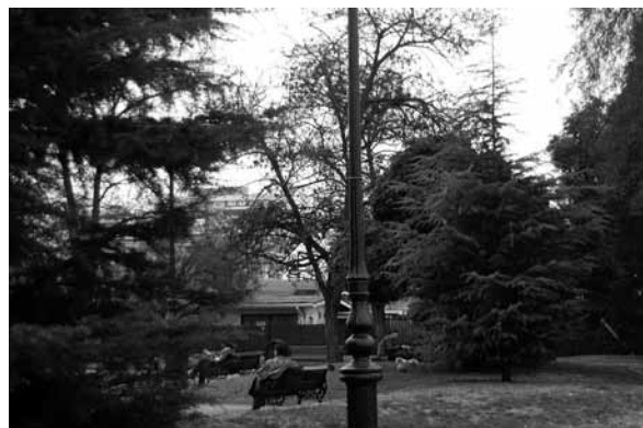
Figura 6 Presencia y variedad en la vegetación: características propias de los sectores en estudio

Al respecto, el primer indicador considerado para el análisis de esta variable fue la presencia y variedad de elementos naturales . En la Figura 6 se observan las especies vegetales presentes en los espacios públicos analizados, las cuales permiten el contacto con la naturaleza y la caracterización de los lugares por medio del colorido y la textura. En