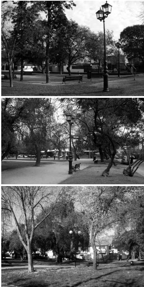
Figura 10 Iluminación en plazas y parques