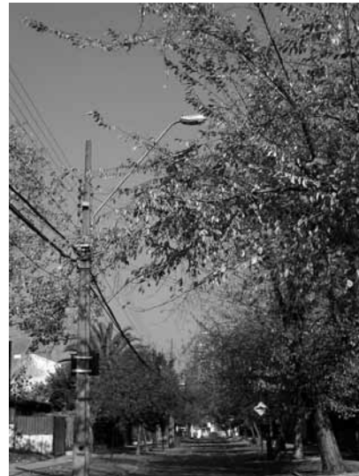
Figura 9 Iluminación en calles: homogeneidad en tipología en ambos casos

En Villa Frei, a diferencia de Villa El Dorado, dentro del mismo conjunto existen áreas para practicar deportes que son muy utilizadas. Por otra parte, en cuanto a los juegos infantiles y mobiliario urbano, la diferencia radica en el carácter que entregan a la imagen del espacio público, vinculado