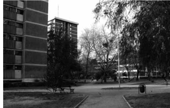
Parque central: edificaciones en altura