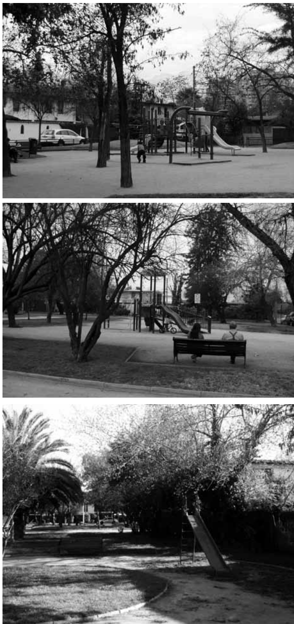
Figura 12 Juegos infantiles y mobiliario que aportan al carácter del paisaje habitacional