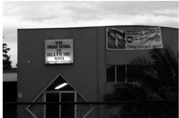
Figura 18 Edificaciones destinadas al desarrollo social