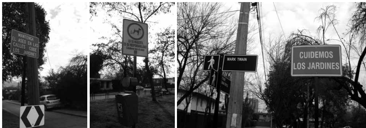
Figura 7 Limpieza y cuidado de espacios públicos: gestión municipal en Villa El Dorado