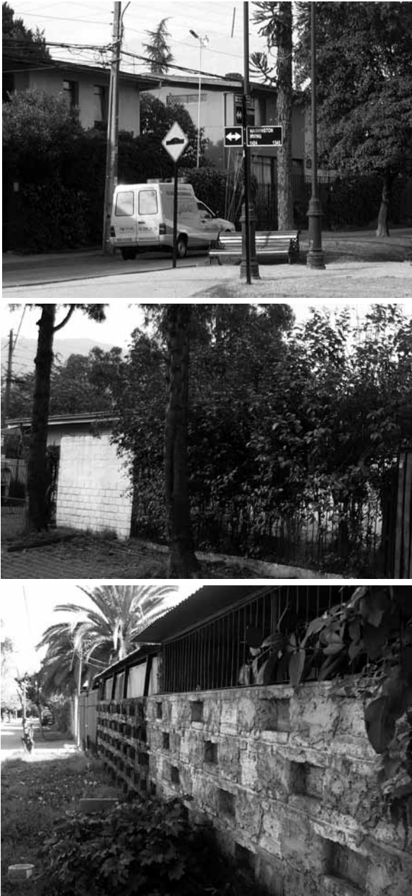
Figura 14 Seguridad en el espacio público y su relación con la propiedad privada