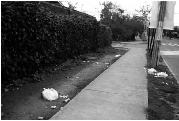
Figura 8 Limpieza y cuidado de espacios públicos: diferencias en Villa Frei