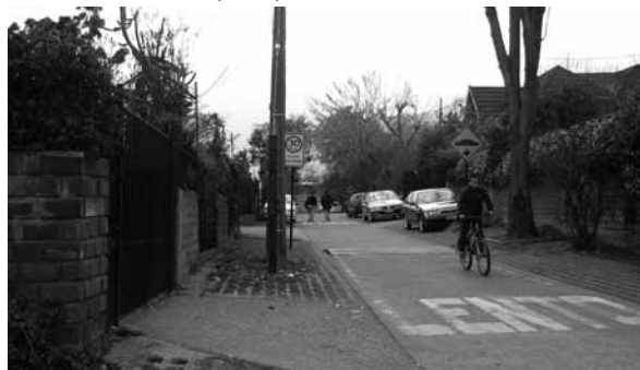
Espacios públicos: áreas verdes