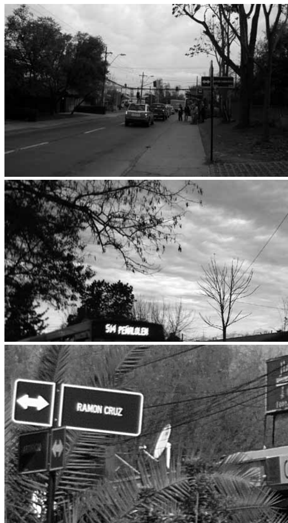
Figura 19 Reconocimiento de circulaciones principales por medio de flujos de transporte público y de usos de suelo comerciales

El otro indicador analizado para esta variable fue la metamorfosis de las unidades habitacionales . Al comparar ambos casos, Villa El Dorado es el máximo exponente respecto a los cambios en las edificaciones de vivienda. Esto no sólo asociado a mejoras, sino a mayor personalización de la vivienda y a su conformación como una unidad hermética, con muy poco contacto directo con el entorno. Esto último responde a transformaciones sociales vinculadas a temas de seguridad,