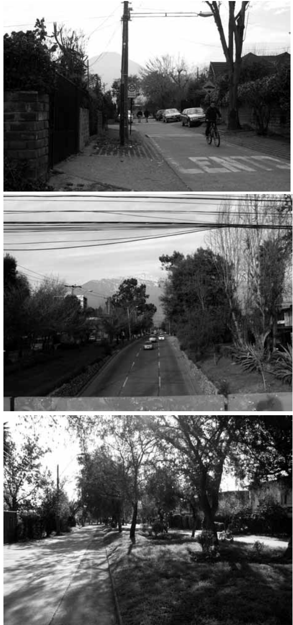
Figura 15 Jerarquización de calles

configuraciones, tal como puede observarse en la Figura 16, relacionados entre sí a través del diseño de cada Villa. Esta relación permitió entenderlos como parte de una estructura sistémica, consecuente con criterios de la ecología del paisaje, a partir de la cual las áreas verdes cumplen un rol fundamental en la funcionalidad y la conformación de la imagen unificadora de cada sector.