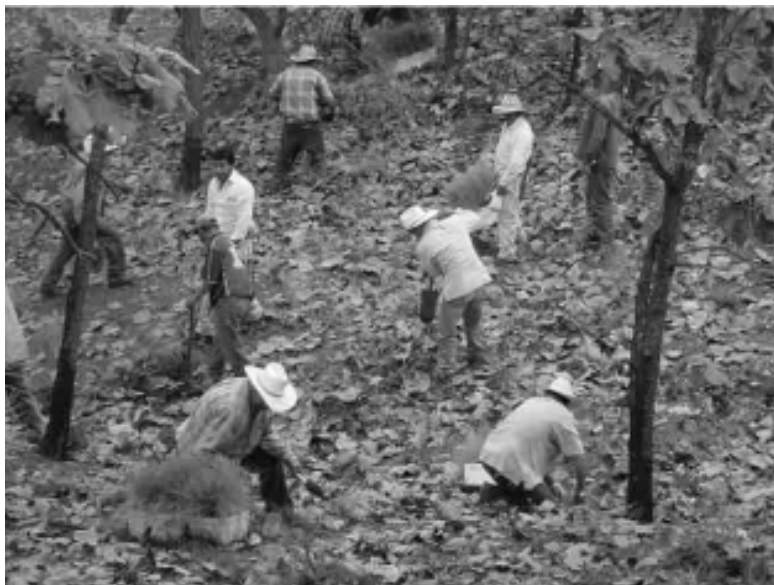
Imagen 2. Plantación forestal comunitaria en la microcuenca Lagunillas

Los “programas” son los proyectos institucionales estatales o federales en los cuales la comunidad participa. Los tres principales son: reforestación y mantenimiento de superficies forestales; conservación de suelos; y, sanidad de árboles enfermos. Los tres proyectos tienen una serie de actividades que demandan la participación de la mayoría de los hombres de la microcuenca (aproximadamente el 70% de los hombres entre 18 y 60 años) y son apoyados por instituciones municipales, regionales, estatales y/o federales. El proyecto de reforestación y mantenimiento contempla las plantaciones forestales, el cercado perimetral de los predios, la apertura y rehabilitación de brechas cortafuego, el recajeteo, la fertilización, las podas, los deshierbes y la eliminación de material combustible (imagen 2). El proyecto de conservación de suelos consiste en la siembra de pastizales y en la construcción de terrazas, surcos transversales y represas para evitar la erosión. El proyecto de sanidad de árboles enfermos implica el control y/o la eliminación de áreas arboladas plagadas por muérdago ( Phoradendron brachystachyum ; MARTÍNEZ, op cit ).