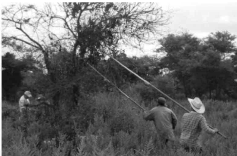
Imagen 5 Control de muérdago ( Phoradendron brachystachyum ) en superficies forestales

En las vidas de los habitantes locales, además de los vínculos y redes sociales que se han logrado a través del proceso de gestión local, se han obtenido experiencias, vivencias, conocimientos e información; se han desarrollado capacidades; se han descubierto habilidades y; se han identificado oportunidades y circunstancias favorables, lo cual ha incrementado sustancialmente la percepción del valor social individual y colectivo. Lagunillas es considerada como el grupo social que lleva la delantera del proyecto de manejo integral de microcuencas en Jalisco. Se destacan aquí las formas en que los participantes locales han capitalizado a través de sus recursos sociales un proceso de desarrollo rural sustentable. Se capitalizaron los recursos sociales y culturales no sólo para lograr el manejo de sus recursos naturales y la obtención de mayores beneficios materiales y monetarios para sus integrantes, sino que también ha contribuido al desarrollo de actores e instituciones que se nutren de la etiqueta del desarrollo sustentable. Los bienes sociales que han capitalizado los participantes locales tienen que ver básicamente con tres rubros: 1) su interrelación con la naturaleza; 2) la vinculación con las instituciones gubernamentales; y, finalmente 3) la conexión al interior de la comunidad (entre las familias, los grupos de trabajo por proyecto, representantes de cada grupo y en la comunidad como tal) (imagen 5).