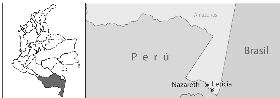
MAPA 1. UBICACIÓN GEOGRÁFICA DEL RESGUARDO TICUNA NAZARETH, AMAZONAS (COLOMBIA)

El proyecto que origina este artículo fue desarrollado en el resguardo Nazareth de la comunidad indígena ticuna, ubicado a una hora desde Leticia, navegando aguas arriba por el río Amazonas (Mapa 1). La población está conformada por 766 habitantes, según censo realizado por el promotor de salud del resguardo para el año 2008. El resguardo es gobernado por un cabildo, en cabeza de un curaca elegido democráticamente cada año, quien direcciona, consultando con sus cabildantes, la utilización de los recursos que reciben del Gobierno nacional mediante la asignación de regalías; hasta el período de realización del proyecto, el sentido de planificación a largo plazo para esta población era débil, por lo cual no se observan inversiones importantes en los temas de saneamiento básico y agua potable, a pesar de expresar la necesidad de estos beneficios.