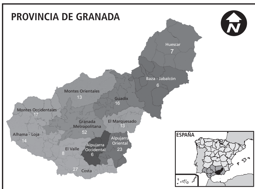
FIGURA 1. Número de asociaciones de mujeres por comarca en la provincia de Granada, Andalucía. (N=202)

El tejido asociativo de mujeres en el territorio granadino cuenta además con una amplia trayectoria, ya que casi dos tercios de las asociaciones (62,4%) superan los 10 años de existencia. Algo menos de 10% son de reciente creación, con menos de cinco años. El nacimiento de las primeras asociaciones de mujeres rurales las sitúa en la década de los ochenta, y coincidieron con dos hechos. Primero, la creación del Instituto de la Mujer (1983) que supuso la articulación de una red de Centros de Información de la Mujer en todo el territorio nacional, así como el establecimiento de Planes de Igualdad de Oportunidades de las Mujeres y de un sistema de apoyo técnico y presupuestario para el desarrollo de sus actividades. Y segundo, el ingreso de España en la Unión Europea (1986), lo que contribuyó al establecimiento del entramado institucional de género, pues se le exigió al país la adopción de la normativa comunitaria en materia de igualdad de oportunidades, al tiempo que España comenzaba a beneficiarse de financiación para estos temas (Puñal, 2001). A partir de entonces, se produjo un importante crecimiento a lo largo de los años noventa como se refleja en el figura 2.