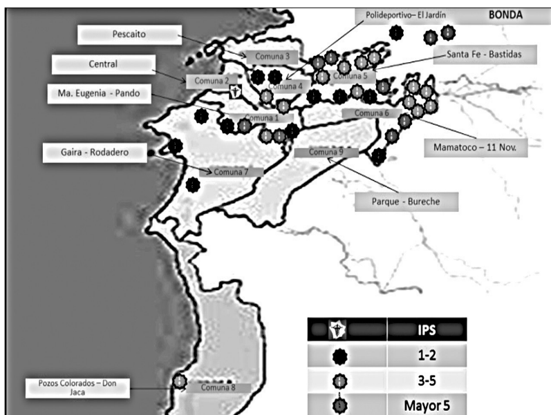
FIGURA 2. DISTRIBUCIÓN GEOGRÁFICA DE HOGARES, MATERNAS E IPS DE CPN DISTRIBUIDAS POR NIVELES DE RIESGO BIOPSICOSOCIAL

Esta información fue comparada con la base de datos de hospitalizaciones de gestantes y neonatos acaecidas durante todo el periodo de estudio, utilizando análisis bivariado con tablas de 2x2, a fin de asociar las variables sociales con factor de riesgo obstétrico.