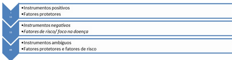
FIGURA 2 Categorização dos instrumentos

Destes 27, foi realizada a separação por tipo de instrumento, ou seja, a categorização, o que pode ser visualizado na figura 2. Primeira categoria: instrumentos considerados negativos, com abordagem aos fatores de risco e/ou foco em doença. Segunda categoria: instrumentos considerados positivos, com abordagem aos fatores protetores. Terceira categoria: instrumentos que foram considerados ambíguos, que abordavam ambos os fatores.