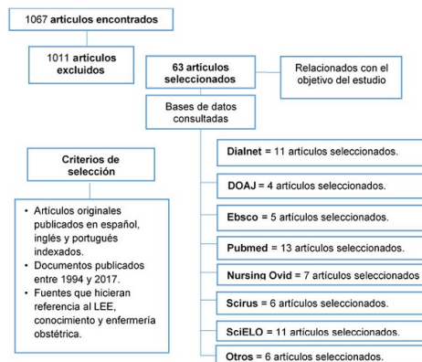
FIGURA 1 Proceso de búsqueda revisión integrativa de la literatura

Las unidades de análisis se seleccionaron a partir de la lectura inicial de los títulos, de los resúmenes y de los textos completos de acuerdo con el objetivo de la revisión. La información obtenida se ordenó por temáticas conformadas a partir de la reducción y síntesis de los datos relevantes en una ficha en Excel construida previamente. Los resultados de la investigación se organizaron en tres categorías: conocimiento contemporáneo de enfermería, proceso de atención de enfermería y estrategias para la aplicación del LEE materno-perinatal. Se ubicaron 1067 artículos, de los cuales se seleccionaron 63 piezas científicas que respondían al objetivo y criterios de selección (figura 1).