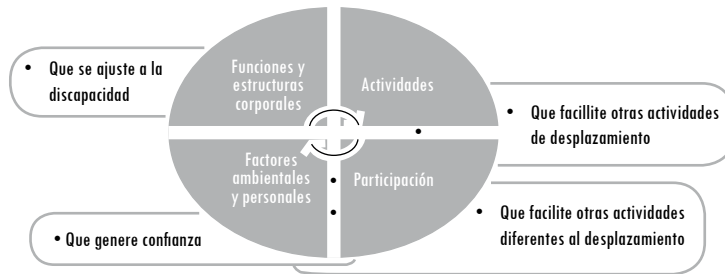
Figura 2. Categorías que agrupan la opinión del usuario respecto a los componentes de la CIF