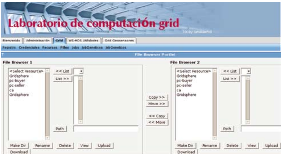
Figura 6. Portlet para el manejo de archivos remotos