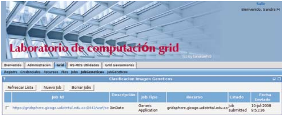
Figura 5. Lista de jobs en recursos en la grid