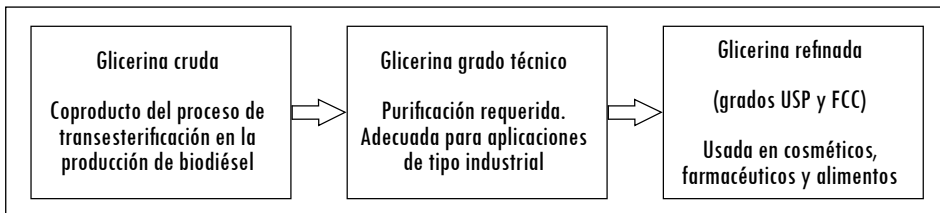
Figura 1. Calidades de la glicerina