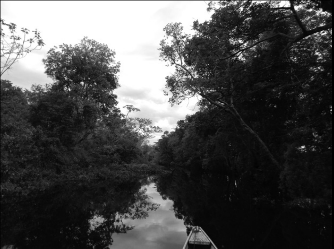
Playa Güfo, 2013.