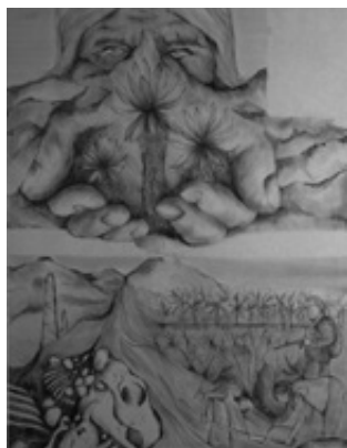
Imagen de portada: María Camila Espindola Ilustración en técnica mixta www.behance.net/camilasp