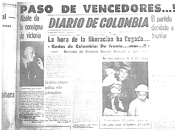
Titulares de Diario de Colombia, el 16 de marzo día de elecciones parlamentarias.

Como a la élite, el advenimiento del liberalismo al poder atemorizaba a los conservadores de la provincia. Sospechaban que de sorprenderlos divididos el nuevo orden político, perecerían sin remedio. Se refleja esta angustia en los mensajes venidos de los Santanderes y de Boyacá. Un grupo de jóvenes estudiantes de la ciudad de Cúcuta manifestó haber heredado ese temor por el adversario: "en defensa de nuestro partido y religión derramaremos nuestra sangre. En nuestras tumbas pedimos se ponga la bandera azul color del cielo" 13