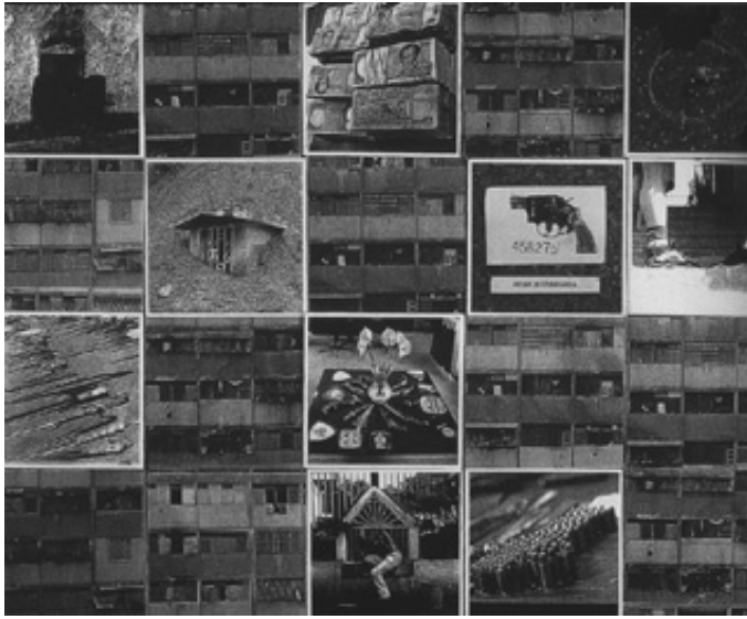
Autor: Susana Arwas. Título: Más salao que un bacalao, de la serie Audiovisuales, 1999. Fuente: María Teresa Boulton. 21 Fotografías Venezolanas. Caracas: Fundación Cisneros, 2002; 157.