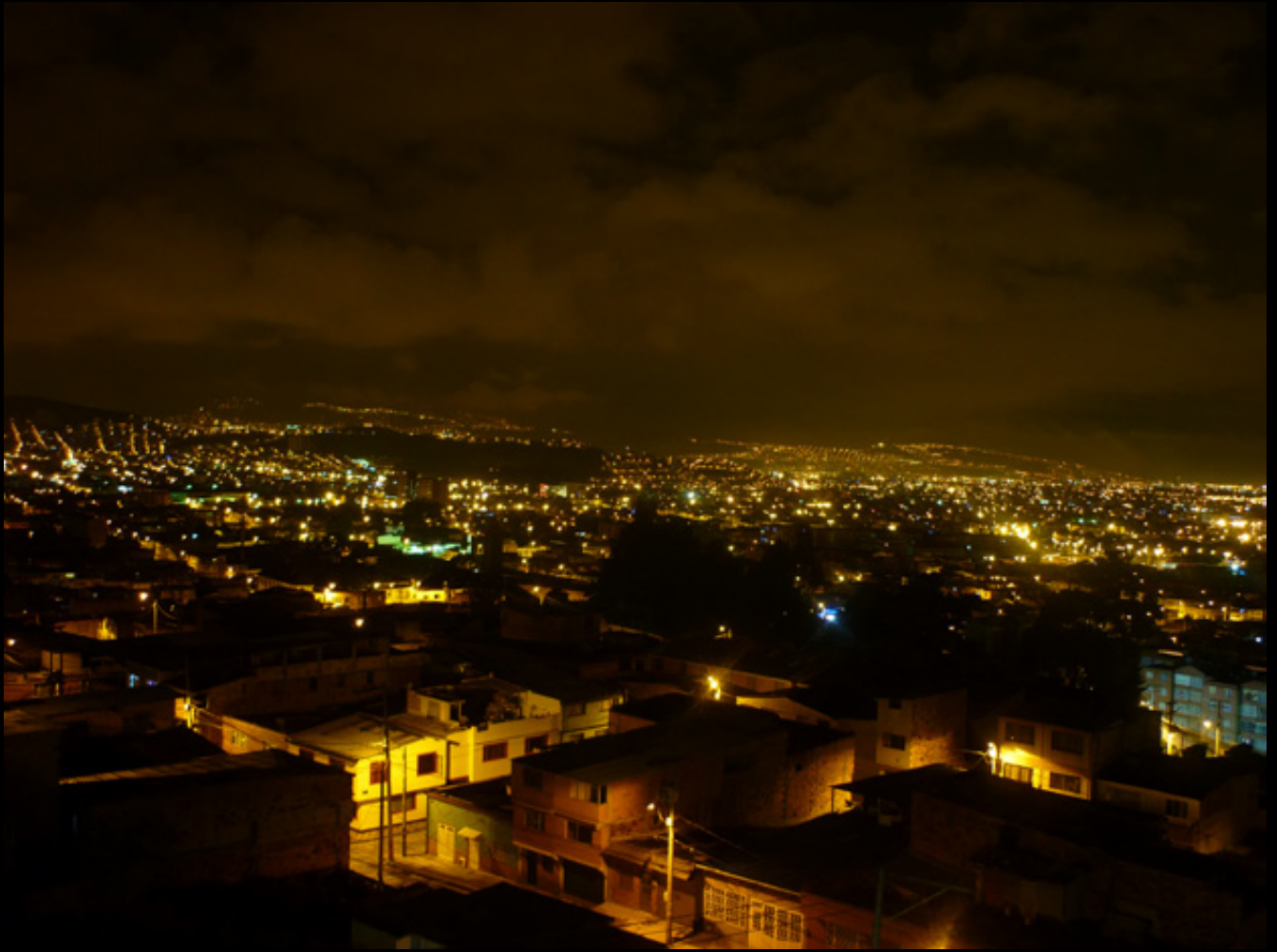
Título: Noche en las brisas, Bogotá Colombia, 2012. Autor: Ángel Luis Román Tamez