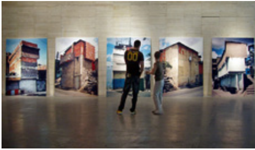
Alexander Apóstol. Ranchos, de la serie Residente Pulido, 2003. http://www.alexanderapostol.com/06_residenteRanchosbis.php

fotográficos de un archivo visual sobre Caracas donde el caos es inherente a la condición urbana. Es una aproximación documental de la imagen de la ciudad contemporánea, a cualquiera de ellas. Lo que se ve sitúa al espectador frente a la representación de un imaginario urbano sin frontera: