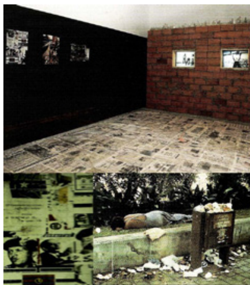
Autor: Antonieta Sosa.

Por otra parte, en la misma búsqueda reflexiva sobre el tema de la violencia que abanderó más de un artista contemporáneo latinoamericano, en el periodo de finales del siglo xx y comienzos del siglo xxi, la reconocida fotógrafa venezolana Susana Arwas, ganadora de varios premios nacionales, produjo, en 1999, la serie Audiovisual en la que destaca el collage Más salao que un bacalao . En esta obra, la artista muestra más de un icono del lado oscuro de la ciudad, al que todos los latinoamericanos parecen estar acostumbrados. Se trata de la imagen de una ciudad violenta por naturaleza, asediada por los problemas de pobreza,