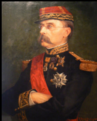
Louis Faidherbe, 1883. Musée de l'Armée (Invalides, Paris)