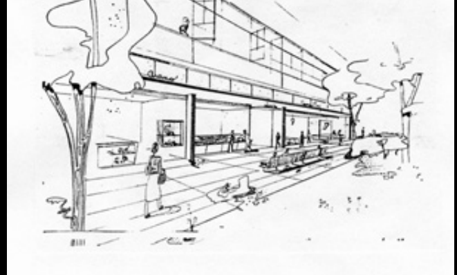
Propuesta de reforma a la plaza de mercado central realizada por L. Amorcho. Revista Proa No. 3 de 1946. Banco de la República (Colombia).