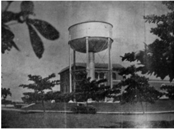
Imagen 1. Planta de filtración del acueducto de Barranquilla

El acueducto abastecía a los barrios habitados por la élite y autoridades locales, además de las fábricas y casas comerciales. AHA, Colección Hemerográfica, Revista Mejoras , Barranquilla, junio de 1937.