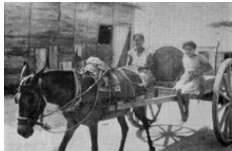
Imagen 6. El Bosque

BPC, América pintoresca. Descripción de viajes al nuevo continente por los más modernos exploradores: Carlos Wiener, Doctor Crevaux, D. Charnay, etcétera, etcétera (Barcelona: Montaner y Simón Editores, 1884), 493.