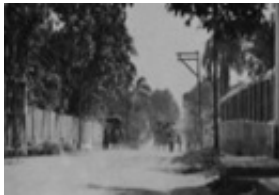
Imagen 3. Avenida de la República

La fotografía es de finales de la década de 1930 y hace parte de la colección personal de Helkin Núñez (Funcionario del Archivo Histórico del Atlántico).