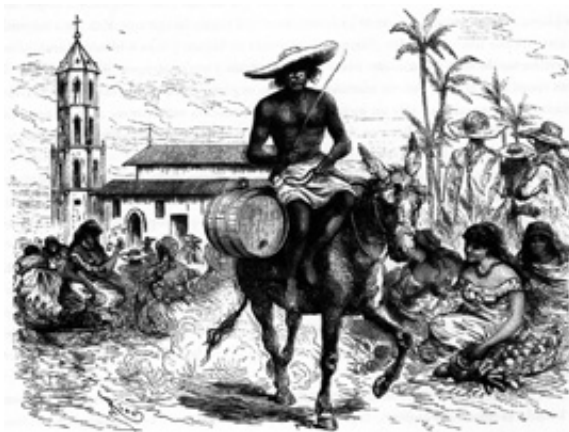
Imagen 5. Aguador de Barranquilla

BPC, América pintoresca. Descripción de viajes al nuevo continente por los más modernos exploradores: Carlos Wiener, Doctor Crevaux, D. Charnay, etcétera, etcétera (Barcelona: Montaner y Simón Editores, 1884), 493.