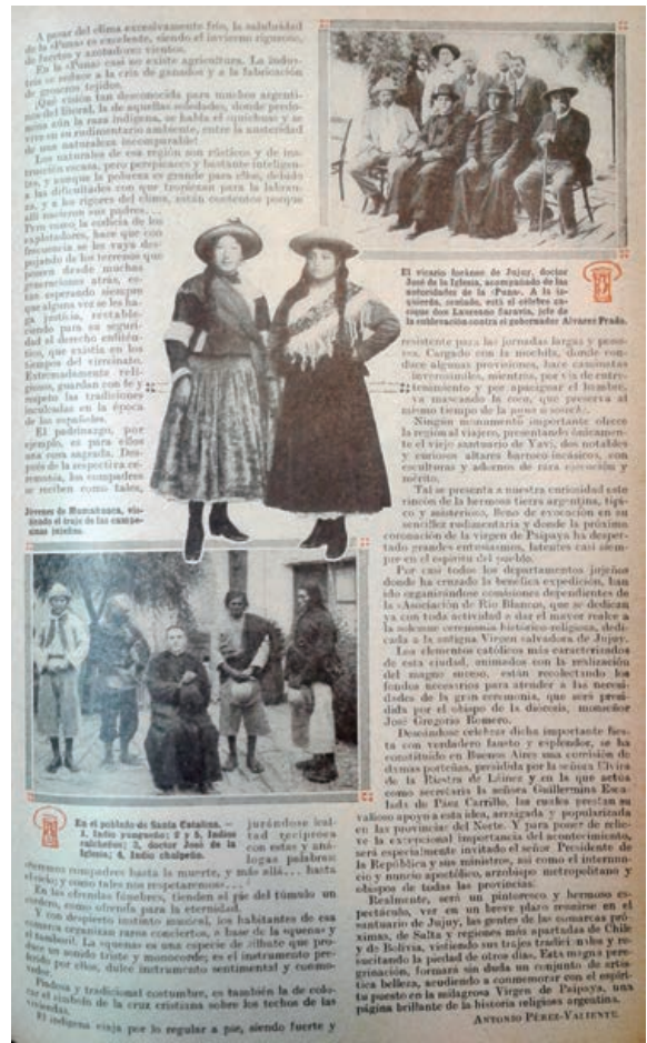
Figura 6. Notas Jujeñas. Fuente: Antonio Pérez Valiente, «Notas Jujeñas», Caras y Caretas XXI, n.º 1045 (12 de octubre de 1918).

Se consideraba que aquella región remota vivía por las supervivencias del pasado colonial más que por aquellas propias de la sociedad contemporánea criolla (civilizada en términos de la época). Esas ideas que asimilaban la naturaleza con el pasado y la civilización con el presente se complementaban con las representaciones de los indios: coyas pintorescas, por un lado, y maticos pobres, migrantes golondrinas provenientes del Chaco, que trabajaban en la zafra de los ingenios de azúcar jujeños, por el otro. Con un tono paternalista, el periodista de Caras y Caretas sostenía que ellos estaban sujetos a la tradición: «Los naturales de esa región son rústicos y de instrucción escasa, pero perspicaces y bastante inteligentes, y aunque la