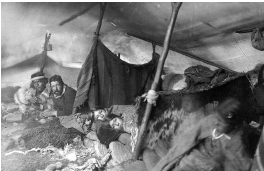
Figura 2. Group in Costume and Non-Indian Man, Trader, Inside Toldo (Skin and Pole Tent) Showing Sleeping Arrangements Divided by Blanket Screens into Compartments; Animal Skins and Beddings. JAN 1898.