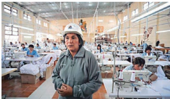
Figura 12. Para mantener presa a Sala en Jujuy se construyó una ficción. Foto de A. Beltrame. Fuente: Gerardo Aranguren, «Para mantener presa a Sala en Jujuy se construyó una ficción», Tiempo Argentino [Buenos Aires], 29 de abril de 2016.

se repiten en la prensa hegemónica. Esta foto muestra a una mujer al frente de un taller textil en el que otras mujeres trabajan para ganarse la vida.