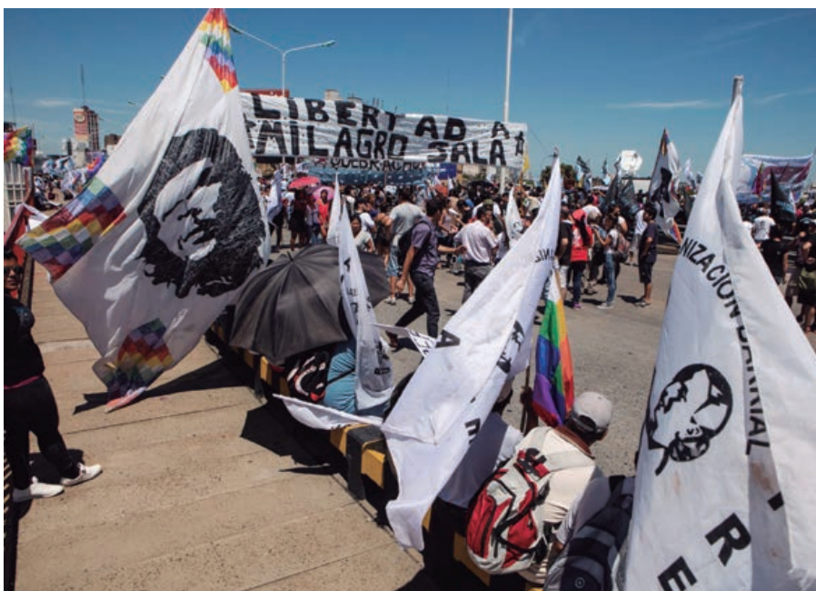
Figura 11. Los kirchneristas colapsan Buenos Aires para pedir una excarcelación. Foto de Ricardo Ceppi. Fuente: Carlos E. Cué, «Los kirchneristas colapsan Buenos Aires para pedir una excarcelación», El País [Buenos Aires], 3 de marzo de 2016.

más ligado al registro del allanamiento que a un fotógrafo, para mostrar un registro que no suponía la intervención de periodistas. Sin embargo, en términos visuales, no hay elemento alguno que permita demostrar que allí podría haberse ocultado dinero, como se afirma en el título del artículo periodístico. Aun así, el efecto que esas notas tuvieron en la sociedad fue totalmente efectivo para estigmatizar a la dirigente jujeña.