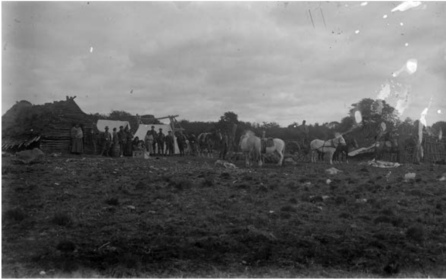
Figura 3. Viaje a Tierra del Fuego, 1902.

de origen criollo, las mujeres indígenas, sus viviendas, el entorno natural y los animales (Figura 3). Las relaciones entre distintos grupos sociales muchas veces han sido dejadas de lado por las investigaciones, pero numerosas imágenes de los viajeros permiten observar los lazos y los intercambios, así como un tiempo que se comparte.