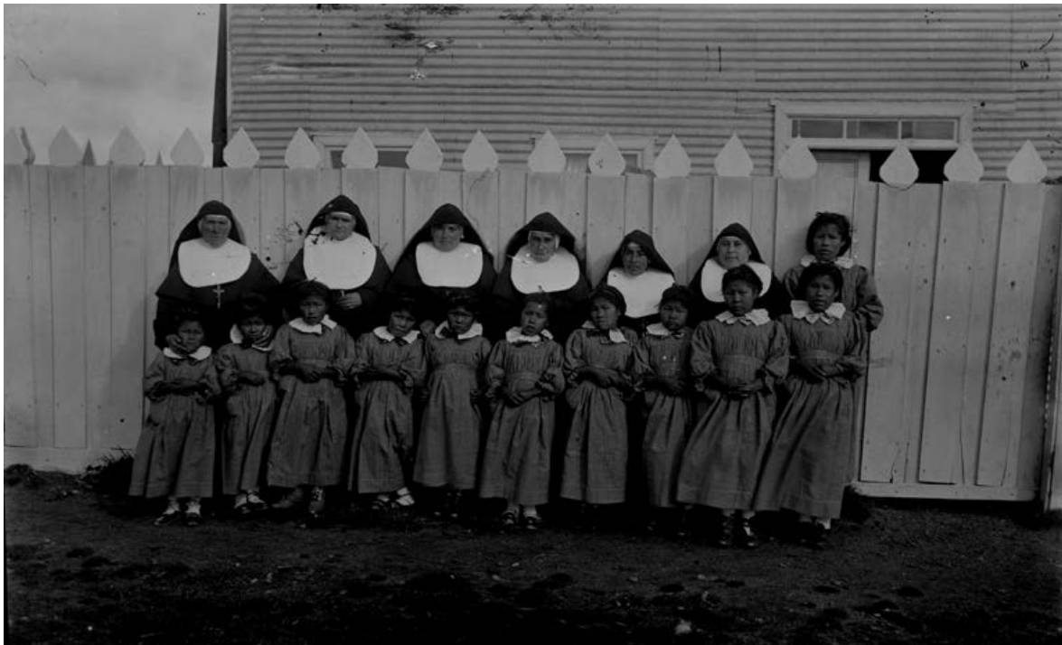
Figura 5. Viaje a Tierra del Fuego, 1902.

mujeres adultas mantienen su ropa tradicional y una actitud que responde a su propia cultura. Además, se ponen de manifiesto ciertas representaciones de la temporalidad. Las niñas aluden al futuro y las madres al pasado.