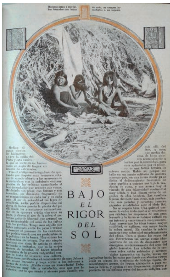
Figura 7. Bajo el rigor del Sol. Fuente: Santiago Fuster Castresoy, «Bajo el rigor del Sol», Caras y Caretas XXIV, n.º 1175 (9 de abril de 1921).

Pero como la codicia de los explotadores, hace que con frecuencia se les vaya despojando de los terrenos que poseen desde muchas generaciones atrás, están esperando siempre que alguna vez se les haga justicia, restableciendo para su seguridad el derecho enfiteúico, que existía en los tiempos del virreinato. Extremadamente religiosos, guardan con fe y respeto las tradiciones inculcadas en la época de los españoles. 12