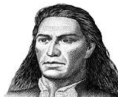
Figura 17. Imagen prototípica de Tupac Amaru II difundida en internet.

Como contrapartida a aquellas representaciones, una imagen diferente de Milagro ha recorrido el mundo. Se trata de una foto realizada por el fotoperiodista Sebastián Miquel, utilizada por un colectivo denominado «Todos somos Milagro» para solicitar la liberación de la líder social. 27 Numerosos artistas y políticos de Argentina y el mundo se sacaron fotografías usando la mitad de esa foto de Milagro sobre el propio rostro (Figuras 18 y 19). Justamente la unión entre la mitad de la foto de Milagro y la de la personalidad que pide por su liberación apela a la contemporaneidad de los dos sujetos, a la unión entre los/las dos, es decir, aquello que la perspectiva en contra de la líder social justamente quiere evitar, quebrar e impedir.