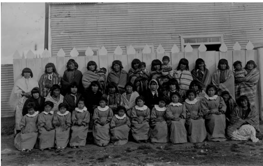
Figura 4. Viaje a Tierra del Fuego, 1902.

mujeres y los de hombres. El montaje del conjunto de fotografías está fuertemente ligado al orden establecido por los curas. Más que un registro etnográfico pareciera una exhibición de la organización salesiana; las imágenes resaltan el proceso de transformación que los salesianos han profundizado con los indígenas. En una foto que retrata a las mujeres (Figura 4), las niñas están prolijamente sentadas sobre un banco en la fila inferior, en el medio están las adultas, y por detrás hay otras que están de pie. Se pone en evidencia el gran contraste entre las niñas y sus madres. Mientras que la generación joven lleva vestimenta occidentalizada y una pose corporal acorde a sus uniformes, las