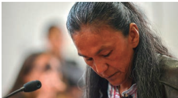
Figura 16. De Milagro Sala al fiscal Nisman. Fuente: Claudio Fantini, «De Milagro Sala al fiscal Nisman», La Voz del Interior [Córdoba], 21 de enero de 2017.

en día ellas logran difundir su palabra. Durante uno de los juicios que se le hicieron a Milagro, a principios de 2017, apareció en la televisión y se le realizaron nuevas fotografías. Varias de ellas la muestran con el pelo recogido, seria y preocupada pero haciendo el gesto de la victoria con las manos. Uno de esos días en que la prensa podía entrar al recinto del juicio, Milagro se dejó el cabello suelto, solo una parte recogida hacia atrás. Una nota periodística, que trata de tomar distancia tanto de las visiones en contra de Milagro Sala como a favor de ella, la muestra con ese peinado mirando hacia abajo. 26 Una imagen diferente a las anteriores al juicio. Una imagen que forma parte de cómo ella quiso mostrarse en esa instancia. Una imagen que la asemeja al líder que varios siglos antes se opuso al poder español colonial y que es la referencia para el nombre de la agrupación que ella fundó y lidera: Tupac Amaru (Figuras 16 y 17). Hace 100 años las mujeres indígenas fotografiadas fueron asimiladas a la naturaleza, a los animales, no tuvieron nombre ni voz. Milagro tiene nombre y apellido, es una dirigente, hay mucha gente que la escucha y la defiende. Ella misma tiene la oportunidad, aunque sea despareja, de contar cómo se alteraron y montaron las fotografías que pretenden difamar su vida y sus reclamos, incluso en la cárcel.