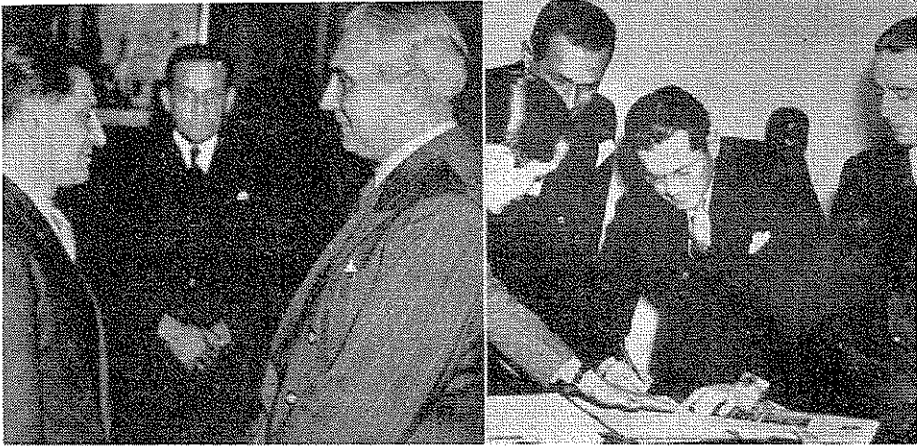
Entrega del documento "Memorial de Agravios" al presidente Ospina Pérez

ciaba la persecución de que estaban siendo víctimas los militantes del liberalismo. En la siguiente imagen se puede ver cómo los demás integrantes de la comitiva minutos antes del encuentro cordial y respetuoso con el presidente, firman el documento. Lo que muestran estas imágenes es el compromiso que tenía Jorge Eliecer Gaitán, como Jefe de la colectividad, con detener la violencia por las vías del diálogo y el entendimiento.