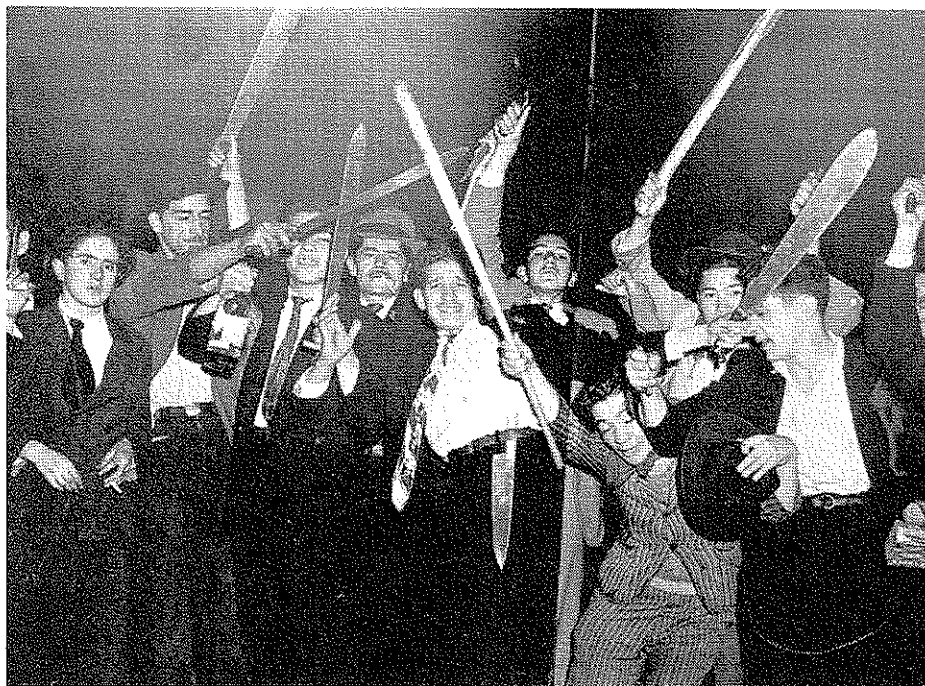
Fuente: González Guillermo. El saqueo de una Ilusión. Santafé de Bogotá: Editorial Número 1997.

años después, vemos que el único autor de la destrucción no fue el fuego que consumió los edificios, encontramos personas de carne y hueso que empuñando las armas, que se tambaleaban entre la impotencia, la embriaguez y el desenfreno.