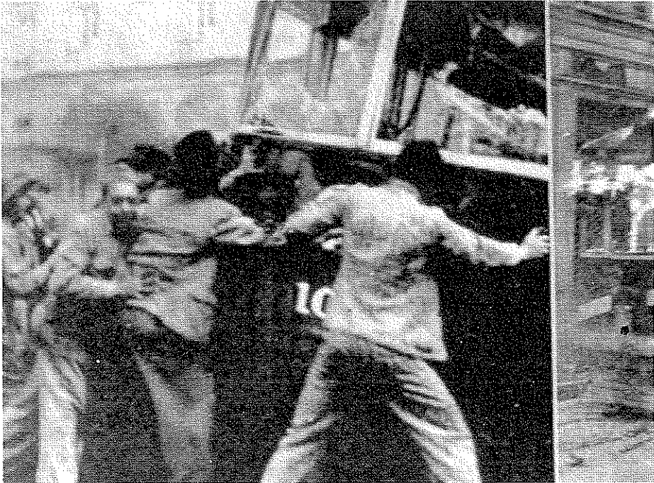
Multitud volcando y quemando tranvías

La fotografía más explícita con respecto a los actores de los desmanes producidos aquella tarde, publicada en la Revista Cromos del 8 de Mayo, es la que presentamos a continuación, donde inclusive es factible reconocer la identidad de los actores y su vigor. Pero igualmente nos dice mucho la intención que tuvo el editor al ubicarla de una forma descentrada y perdida restándole importancia.