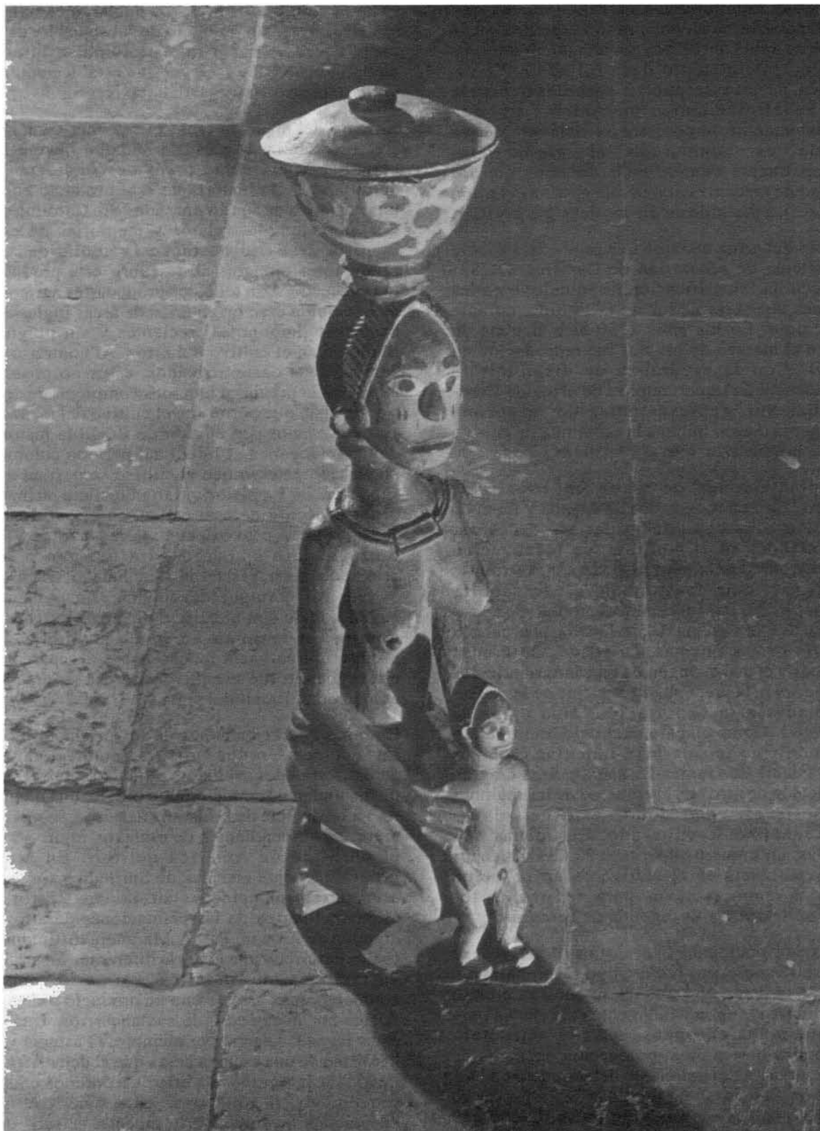
Fotografía de Werner Forman, El Arte Negro. Mexico 1969