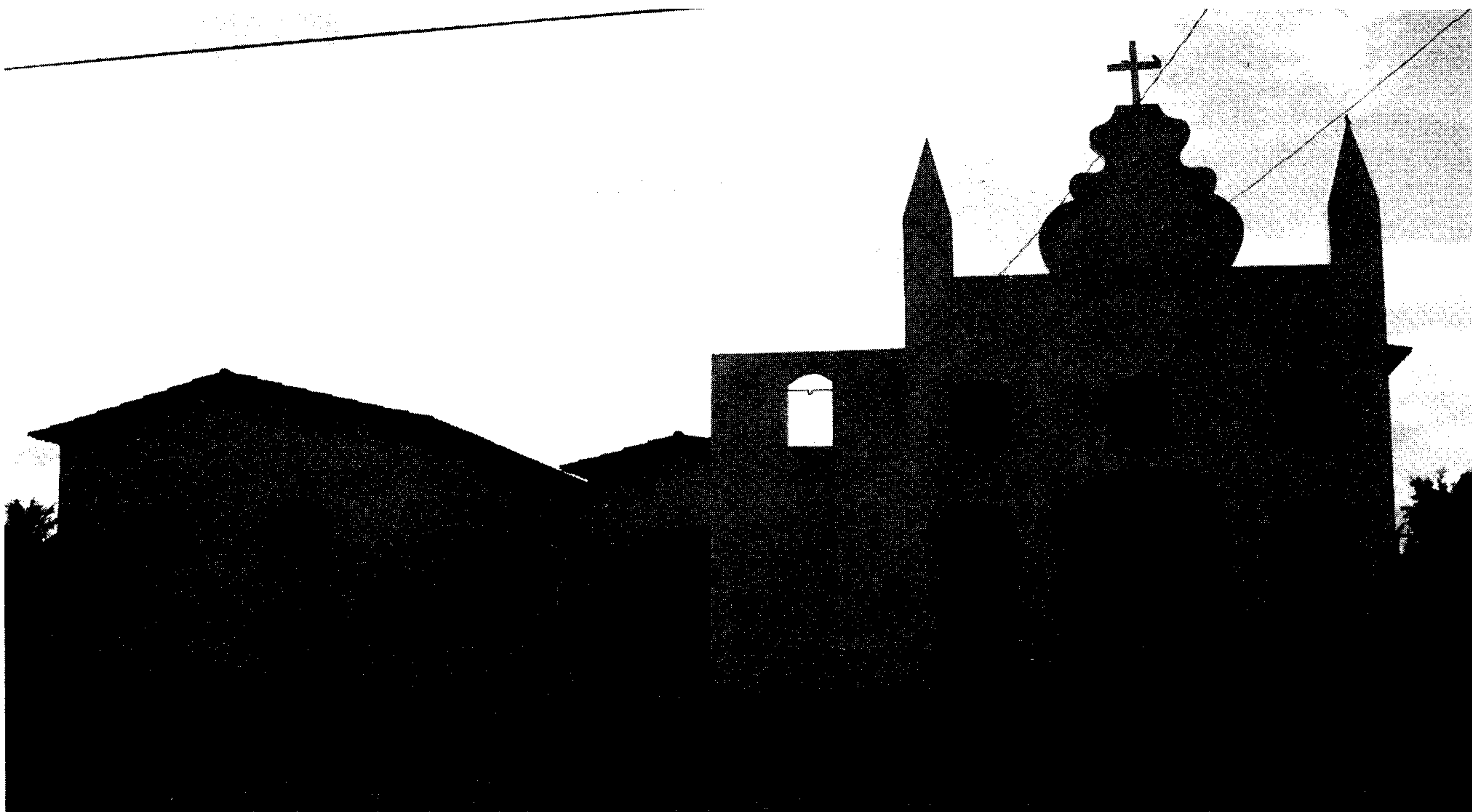
Instituto Popular Memorial de Canudos en Ceara.