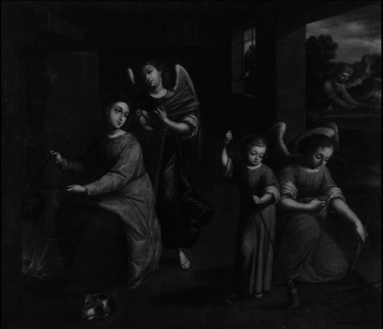
Hogar de Nazareth Gregorio Vásquez de Arce y Ceballos (Atribuido) Óleo sobre tela Siglo XVII Colección Museo Colonial - Bogotá