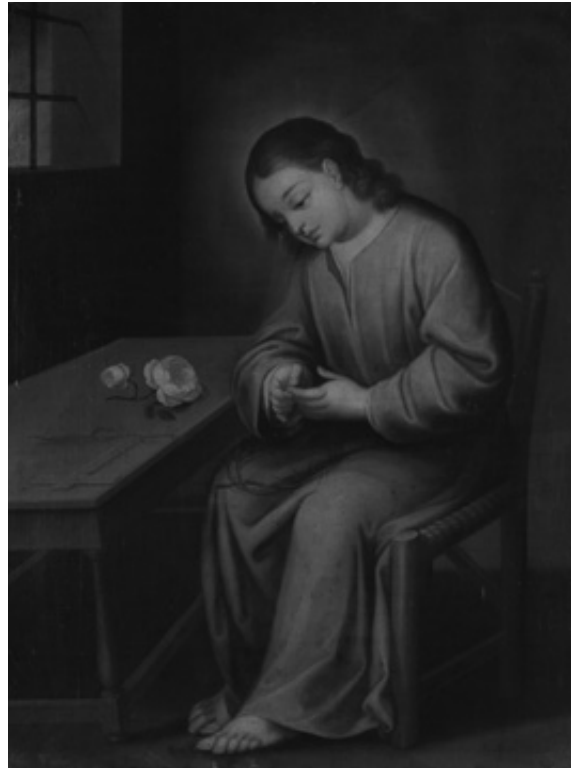
Fig. 8. «El niño de la espina». Gregorio Vásquez de Arce y Ceballos. Siglo XVII. Colección Museo Colonial.

Ahora bien, sumado a todos los anteriores aspectos del llamado «hogar cristiano», está el del niño. Sin duda una de las grandes transformaciones de la estructura familiar en su tránsito entre la estructura extendida, propia del mundo medieval, y la estructura nuclear surgida entre los siglos XVI y XVII es el de la aparición de la niñez 37 . Esta, como la etapa