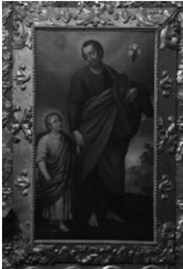
Fig. 7. «San José con el niño». Gaspar de Figueroa. Atrib. Siglo XVII. Colección Museo Iglesia Santa Clara.

corporal, a las de la Virgen con el niño. Siguiendo a Juan Bautista del Toro: