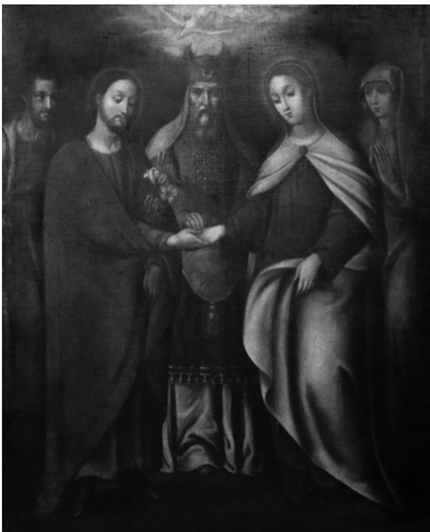
Fig. 3. «Desposorios de la Virgen y San José». Baltasar Vargas de Figueroa Atrib. Siglo XVII. Colección Museo Iglesia Santa Clara, Bogotá.

parte del discurso eclesiástico relacionado con el matrimonio (Fig. 3).