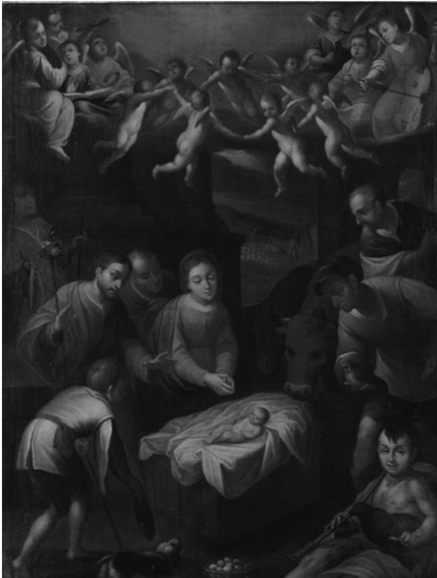
Fig. 1. «Adoración de los pastores». Gregorio Vásquez de Arce y Ceballos, Atrib. Siglo XVII.

a los fieles o utilizando el sermón, la imagen debía mover la actitud de los fieles, encaminando sus actitudes hacia un fin específico.