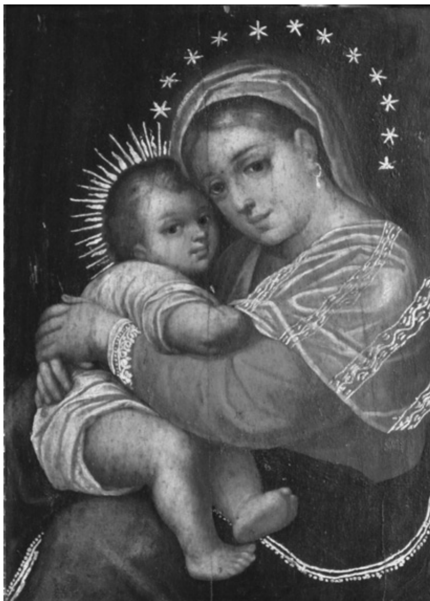
Fig. 6. «La Virgen con el niño». Gregorio Vásquez de Arce y Ceballos, Atrib. Siglo XVII. Colección Museo de Arte Colonial. Bogotá.

también será parte fundamental de representaciones pictóricas como el «Hogar de Nazaret». Si observamos la representación de este tema, atribuida a Gregorio Vásquez, vemos que se refleja claramente la idea del hogar como un convento en el cual cada individuo cumple un rol determinado (Fig. 5).