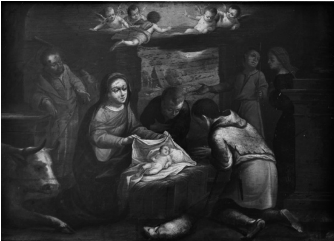
Fig. 4. «Adoración de los pastores». Gregorio Vásquez de Arce y Ceballos Atrib. Siglo XVII. Colección Museo de Arte Colonial. Bogotá.

Este discurso se hace también evidente en algunas obras de los moralistas neogranadinos propios de los siglos XVII y XVIII. Ejemplo de esto es la alusión que hace al tema Juan Bautista del Toro, quien en 1715 publica El secular religioso , una obra dirigida a forjar la religiosidad en aquellos que no pertenecen al mundo conventual. Según del Toro, en la familia