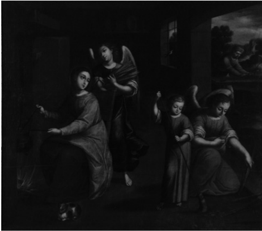
Fig. 5. «Hogar de Nazaret». Gregorio Vázquez de Arce y Ceballos. Siglo XVII.