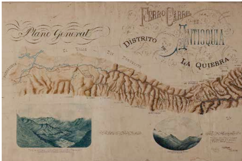
Figura 1: Detalle del “Plano General. Ferro Carril de Antioquia. Distrito de La Quebra. 1893”, por G. T. Spender Fuente: Lenis, Jaramillo y Vélez (2010, p. 62). Original: Fundación Ferrocarril de Antioquia

Si se parte de la premisa que el itinerario cultural no solo atraviesa un territorio o te-