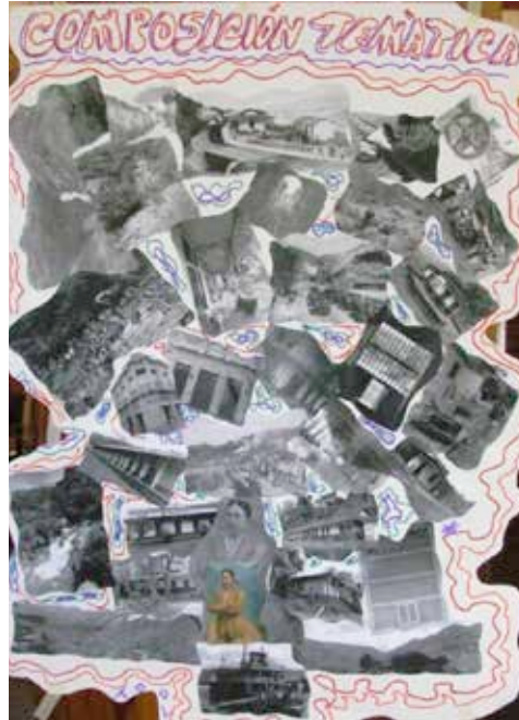
Figura 3: Composición temática elaborada en los talleres comunitarios que representa la integralidad del ferrocarril con el territorio

a las calderas de las vaporinas durante más de 80 años de frecuencia en la vía férrea, se constituye en un aliado común del imaginario ferroviario, que se carga de valor simbólico, en alusión a la región que atraviesa. El Valle del Nus, cuyo nombre deriva del vocablo Tahamí "Nusika", que significa "princesa del valle de muchas aguas" es la prueba, en las voces de sus habitantes, de estas nuevas versiones de identidad e integralidad con el territorio.