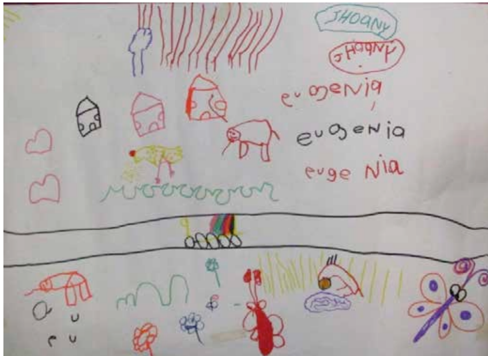
Figura 4: Dibujo de un niño que plasma su imagen del municipio de Cisneros en el taller participativo de creación y re-creación