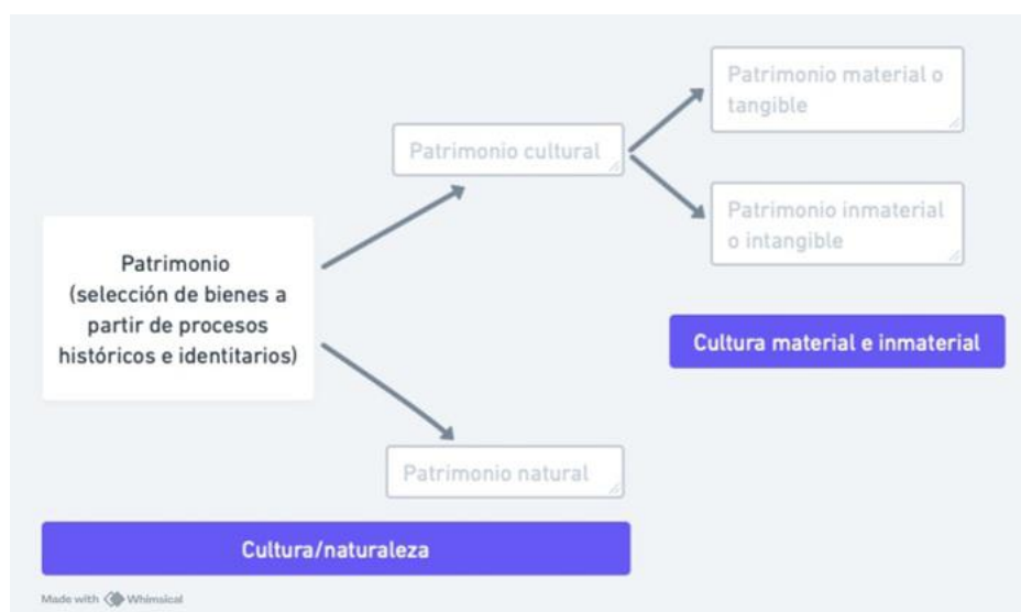
FIGURA 1. Esquema general del patrimonio natural y cultural material e inmaterial

García (1998) señala que el patrimonio no siempre aparece vinculado al concepto de cultura en su sentido más estricto. Para que ciertos elementos se conviertan en patrimonio, se lleva a cabo una selección de materialidades simbólicas que pasan a convertirse en bienes, así adquieren una identidad que los distancia de lo estrictamente cultural. Para ello son necesarios los debates entre organizaciones gubernamentales y no gubernamentales involucradas en el proceso de patrimonialización (Cortés, 2022), cuya gestión contribuye de manera significativa a la preservación de la memoria, en especial cuando dicho proceso es reconocido y valorado a nivel social (Prats, 2005).