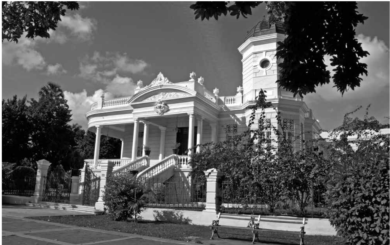
Figura 1: Vivienda porfiriana en Mérida. Fachada principal.

Y es que, de una u otra manera, todos hablamos de la cocina, de su espacio, de sus enseres y de las experiencias que entre sus paredes, trastos, olores, sabores, colores, texturas y rumores, se han vivido. Hacemos referencia a ella cuando platicamos sobre nuestros primeros experimentos con las especias y malabares con los utensilios, cuando rememoramos nuestras comidas favoritas, al referirnos a nuestras costumbres, así como cuando exponemos ante una audiencia –por pequeña o grande que sea– los orgullos culinarios nacionales y familiares. Por tanto, hablar de la cocina y de los alimentos que