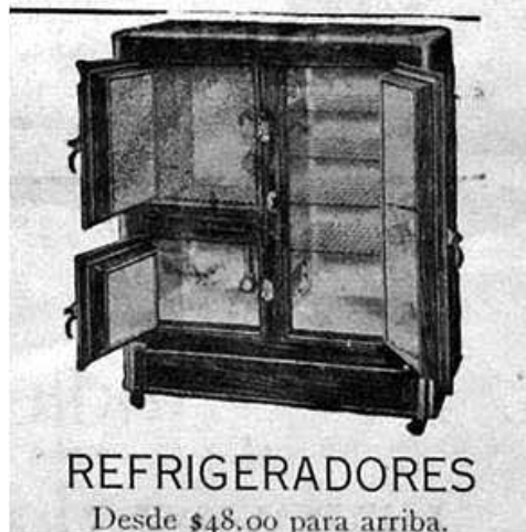
Figura 4: Muebles modernos. Caja fría.

trasparente, y por otra más pequeña localizada en la parte superior de la pared opuesta, esta última únicamente resguardada por barrotes de hierro, facilitando así la circulación permanente de aire. Estas aberturas, al mismo tiempo que permitían pasar la luz natural y que el calor de la cocina saliera, también eran los conductos por donde el olor de los guisados invadía todos los ámbitos de la casa incluyendo los jardines y el patio, convirtiéndose así en un medio para medir el tiempo del cuerpo al despertar el hambre de propios y extraños.