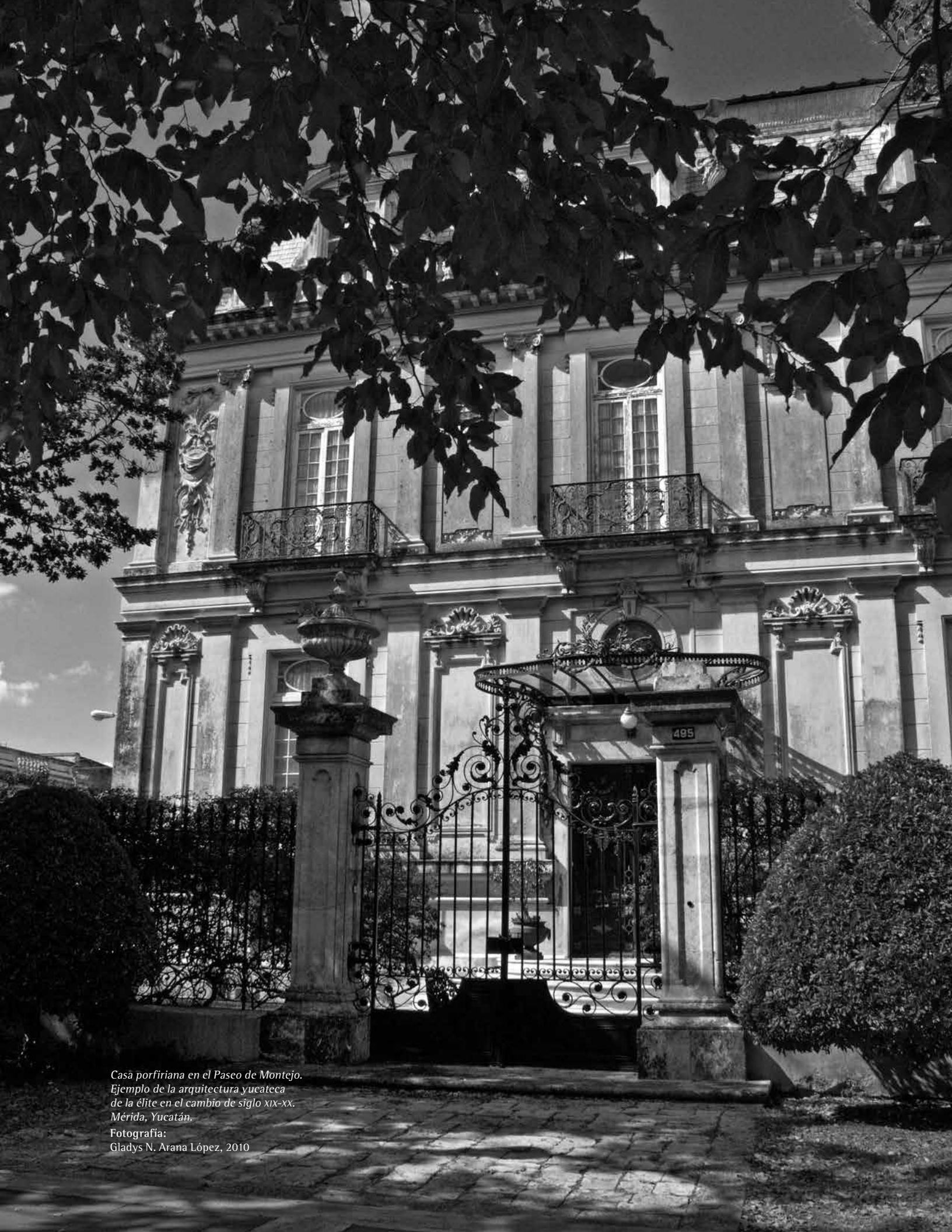
Casa porfiriana en el Paseo de Montejo. Ejemplo de la arquitectura yucateca de la élite en el cambio de siglo XIX-XX. Mérida, Yucatán.