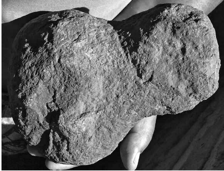
Figura 7: Hacha de piedra.

y colinas ubicados alrededor de Los Guachimontones. Inclusive se mencionó que durante la Semana Santa o Mayor del ciclo ritual católico 10 , los padres, hermanos, tíos y abuelos se iban de cacería a los cerros cercanos, ya que en esas fechas los lugares donde había tumbas prehispánicas y “monos” eran señalados con fuegos fatuos y/o lajas 11 de piedra enterradas de forma vertical en superficie.