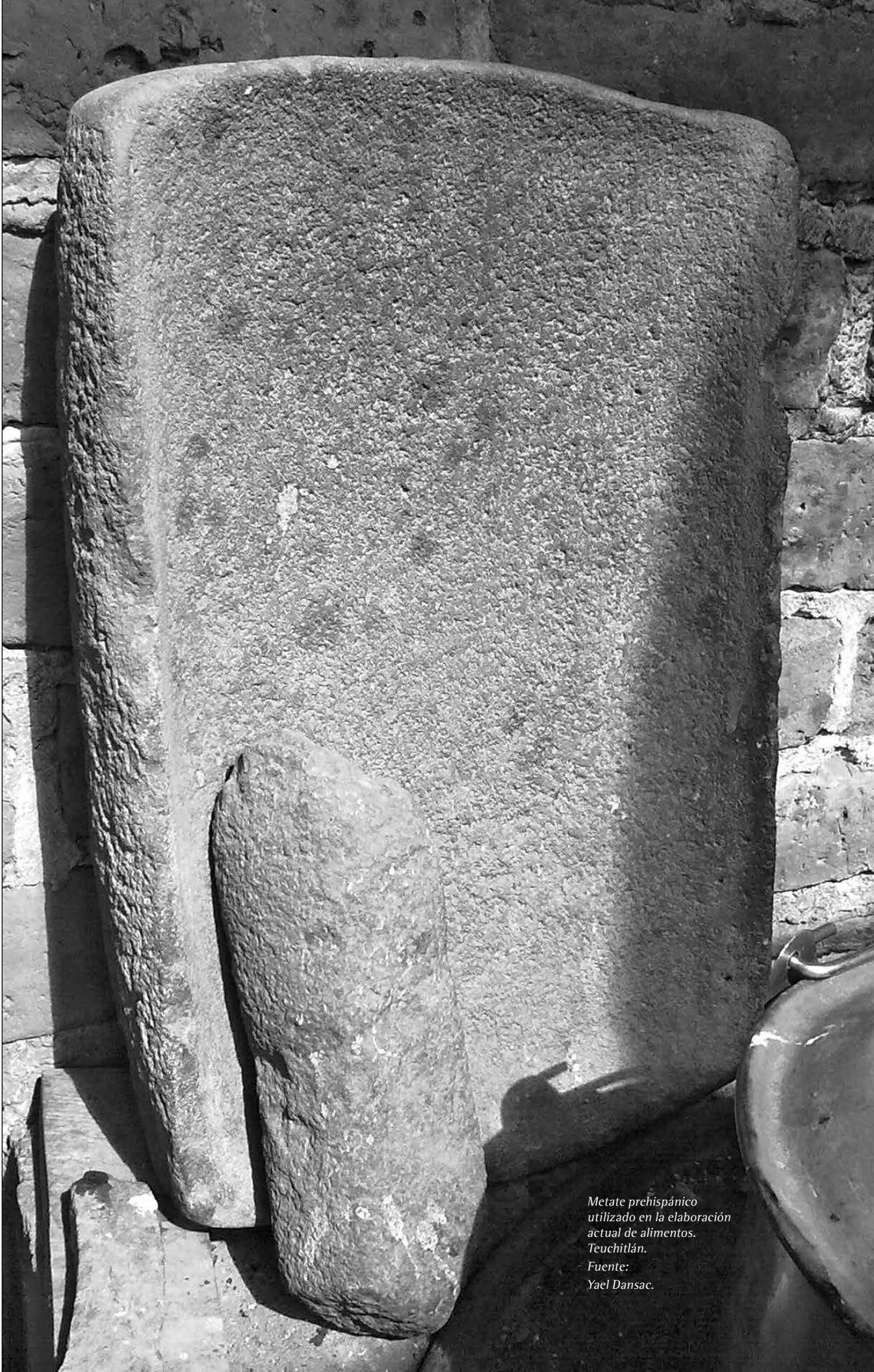
Metate prehispánico utilizado en la elaboración actual de alimentos. Teuchitlán.