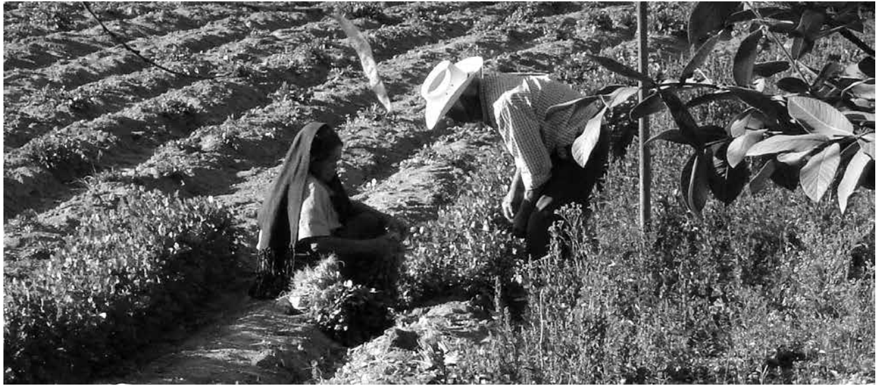
Figura 1: La faena agrícola.

encuentra emplazado en una de las áreas con mayor densidad de sitios y materiales prehispánicos del país: los valles ubicados alrededor del volcán de Tequila, en el estado de Jalisco. Desde la primera mitad del siglo xx (Corona, 1955; Lumholtz, 1904) diversos documentos informaban sobre las tumbas y ruinas prehispánicas que eran saqueadas por los pobladores locales de esa área. Informes más recientes (Dansac, 2011) continúan exponiendo los contactos rutinarios de los habitantes de esa región con los vestigios prehispánicos de su entorno, afirmando con ello el conocimiento generalizado de la población local respecto de la existencia y ubicación de ruinas y objetos arqueológicos en el entorno. En Teuchitlán este conocimiento es materializado en la forma de historias, mitos y relatos. Se espera que la información recolectada sirva para formular mejores argumentos que fomenten la conservación y explotación responsables del patrimonio arqueológico por parte de la comunidad.