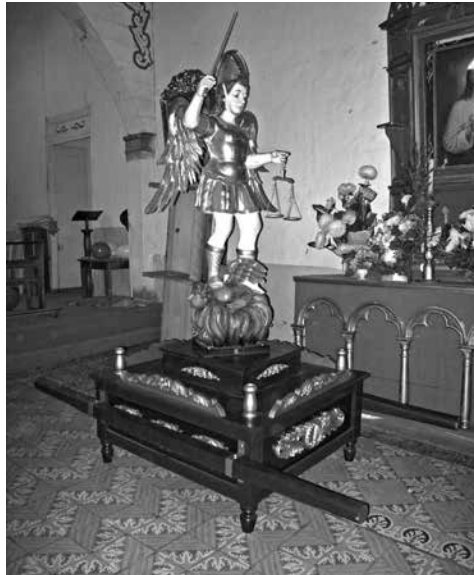
Figura 11: San Miguel Arcángel en la fiesta patronal de Gualmatán. Fotografía: William Pasuy, 2008

De manera previa a la fiesta, se adelanta una novena a los santos patronos como preparación a este tiempo sagrado, no sólo elevando peticiones individuales, sino rogando por el buen desarrollo de la fiesta como actividad colectiva. Las vísperas llevadas a cabo en día sábado son las responsables del llamado al rompimiento de la cotidianidad, evocado a través de dos recursos particulares que tienen un mismo objetivo: la pólvora y las campanas, las cuales simbólicamente se encargan de romper el tiempo para el ingreso a lo sagrado, desde lo católico a lo fiestero popular. Aquí el sonido divide el día y llama a la noche; es el grito de invitación al cambio, a la transición y la reflexión. Cuando el frío llega al límite en conjunción con la presentación de grupos musicales y verbenas populares en el parque principal, la pólvora nuevamente llama la atención a través de “castillos” y “vaca loca”, tradicionales juegos pirotécnicos que cierran la víspera y proyectan el siguiente día, donde pequeños y grandes