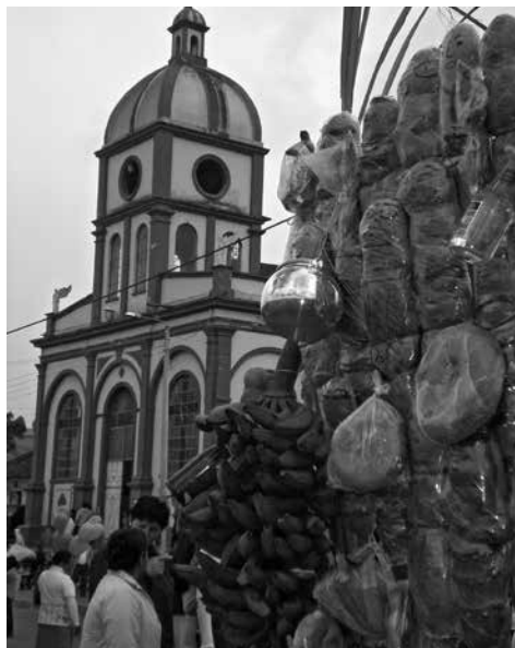
Figura 2: Fiesta y espacio en el corregimiento de Obonuco. Fotografía: William Pasuy, 2008