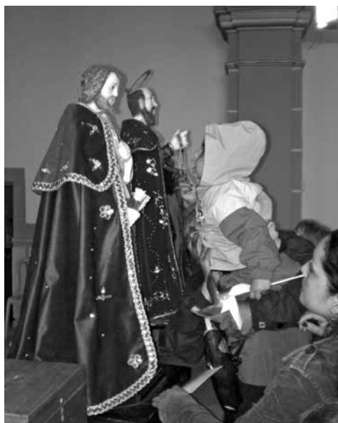
Figura 13: Los santos patronos como símbolo católico en Jongovito. Fotografía: William Pasuy, 2008