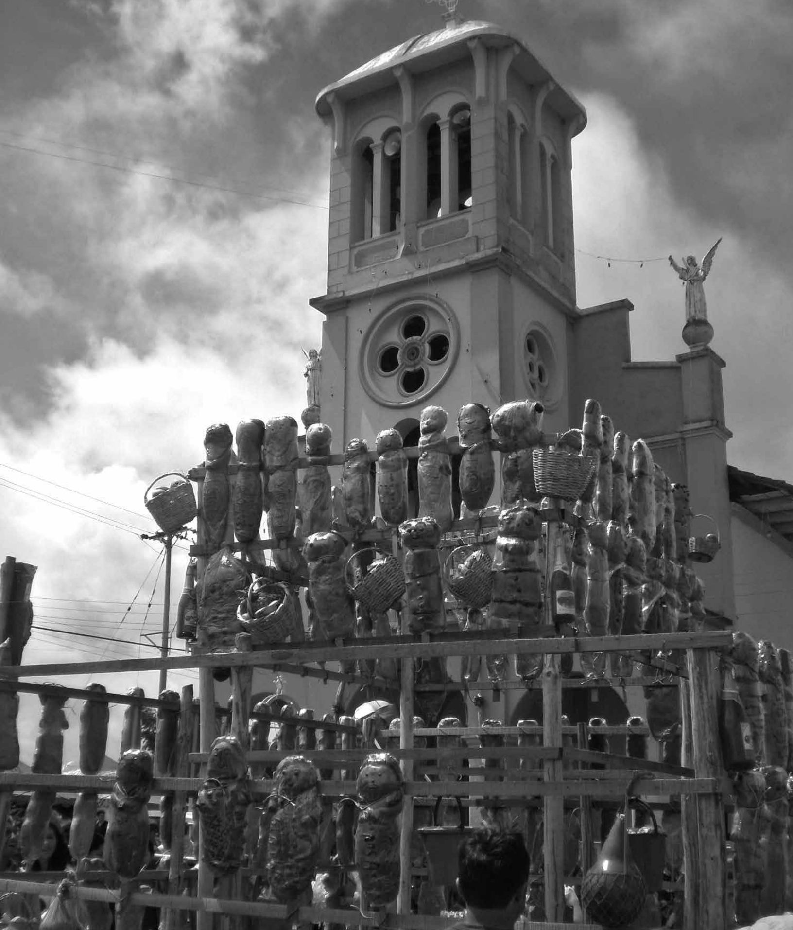
Fiesta patronal del Corregimiento de Jongovito.