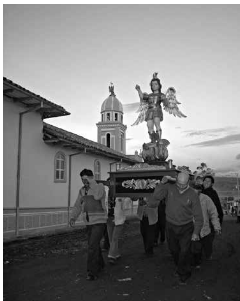
Figura 3: Fiesta patronal de San Miguel Arcángel, corregimiento de Gualmatán.