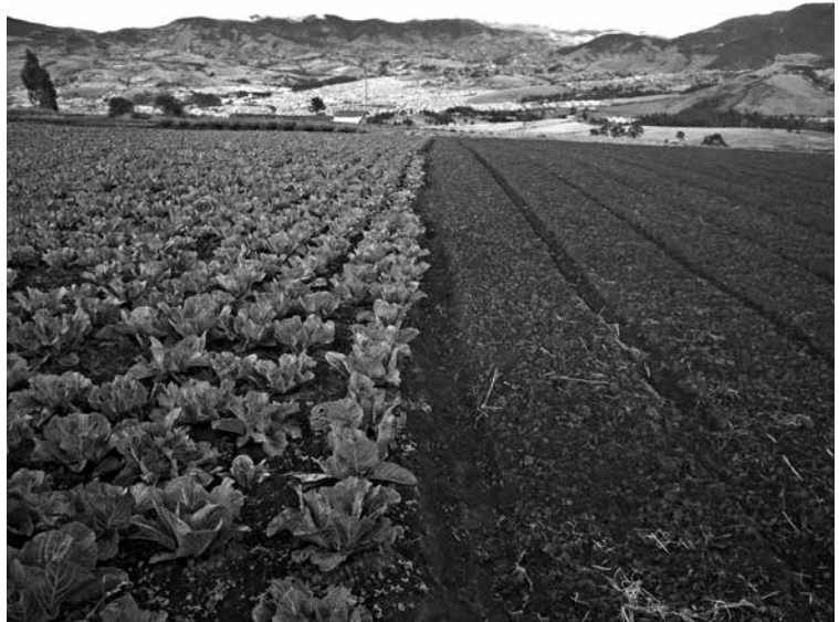
Figura 7: Cultivos en la Pacha Mama en el Valle de Atriz. Fotografía: William Pasuy, 2008

La tradición andina, por origen y tiempo, es primaria por cosmovisión, fruto de una organización social prehispánica, dual y complementaria en un continuo proceso de ir y venir, de entrar y salir, del arriba y el abajo. Los Andes, como columna vertebral, jerarquizan el territorio (Figura 10) como referente social y