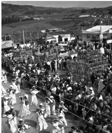
Figura 12: Fiesta y espacio en el corregimiento de Jongovito. Fotografía: William Pasuy, 2008