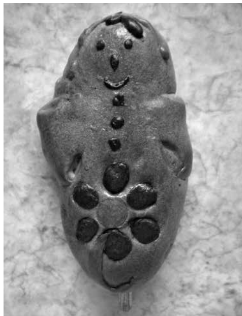
Figura 20: Guagua de pan, Jongovito. Fotografía: William Pasuy, 2008

dio de la fiesta patronal y que será castigado también en doble cantidad, según la tradición (Figura 17).