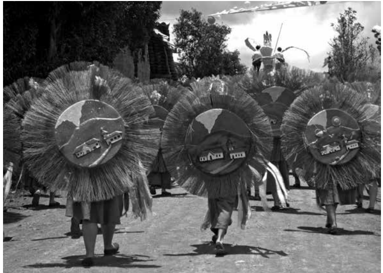
Figura 1: Danzantes en las fiestas del corregimiento de Gualmatán. Fotografía: William Pasuy, 2008

En este orden de ideas, el espacio ceremonial no es otra cosa que el lugar donde se desarrolla, vivifica, comparte y experimenta una realidad posible denominada fiesta patronal , escenificación considerada como un patrimonio cultural material, donde el lugar y los objetos tienden a cambiar de significación; su uso unitario se convierte en múltiple, los hitos y los nodos cambian de jerarquía con los que comúnmente no registraban importancia alguna, y la inversión de valores es un hecho