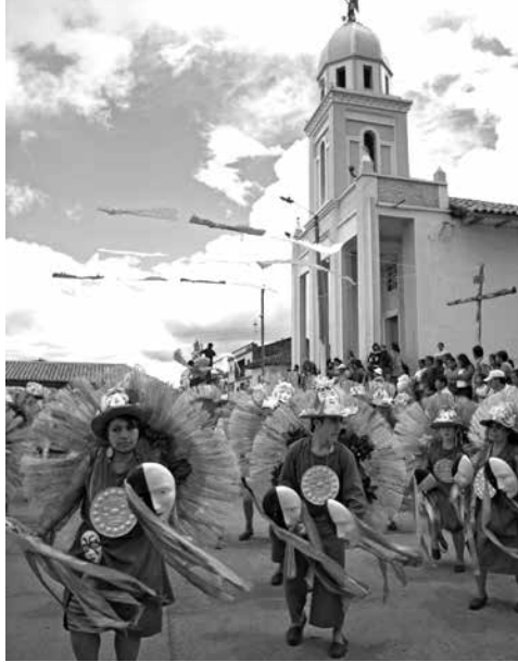
Figura 4: Fiesta y espacio en el corregimiento de Gualmatán.

evidente en un cambio de rol personal, temporal y espacial en el territorio (Figura 5).