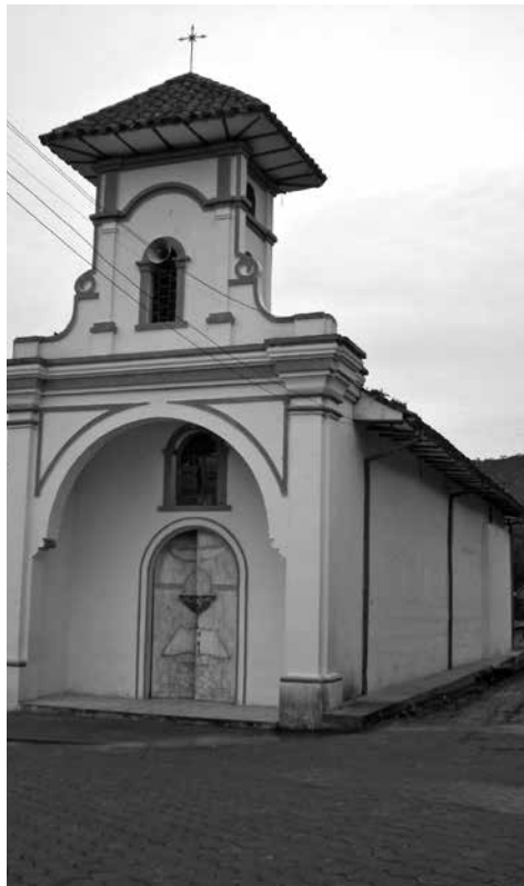
Figura 8: Capilla doctrinera de Tesqual. Fotografía: William Pasuy, 2008

cultural con valor simbólico y mítico-religioso que fundamenta la vida social, política y económica, integrando pisos térmicos, asentamientos humanos y religiosidad, generando una geografía de lo sagrado y evidenciando la dualidad del pensamiento andino como opuesto complementario. Jongovito es muestra de dicha integración a través de la interacción entre lo natural y lo cultural como fenómeno de psicología colectiva.