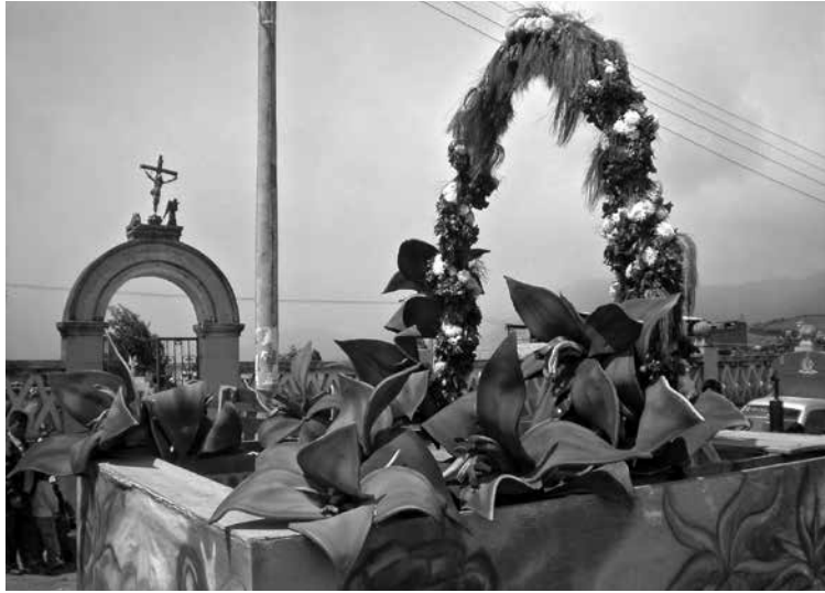
Figura 19: La fiesta patronal y el espacio ceremonial como patrimonio vivo.

nistas son los castillos de san Pedro y san Pablo, donde hacen gala los productos instalados en ellos con un sentido de tributo y agradecimiento, cuyo fin es que personas previamente seleccionadas por el comité organizador puedan tomar uno o varios productos de manera gratuita, convirtiéndose automáticamente en “compadres” o “comadres” de Jongovito. Pero aquí no termina todo; es también un acto sagrado la toma de productos de los castillos de los santos, ya que el compromiso no sólo es llevarse lo seleccionado, sino retornar el doble de la cantidad tomada en la próxima fiesta el año siguiente; si el nuevo compadre no cumple lo estipulado, se argumenta que los santos no acudirán a cumplirle con lo que solicitó en me-