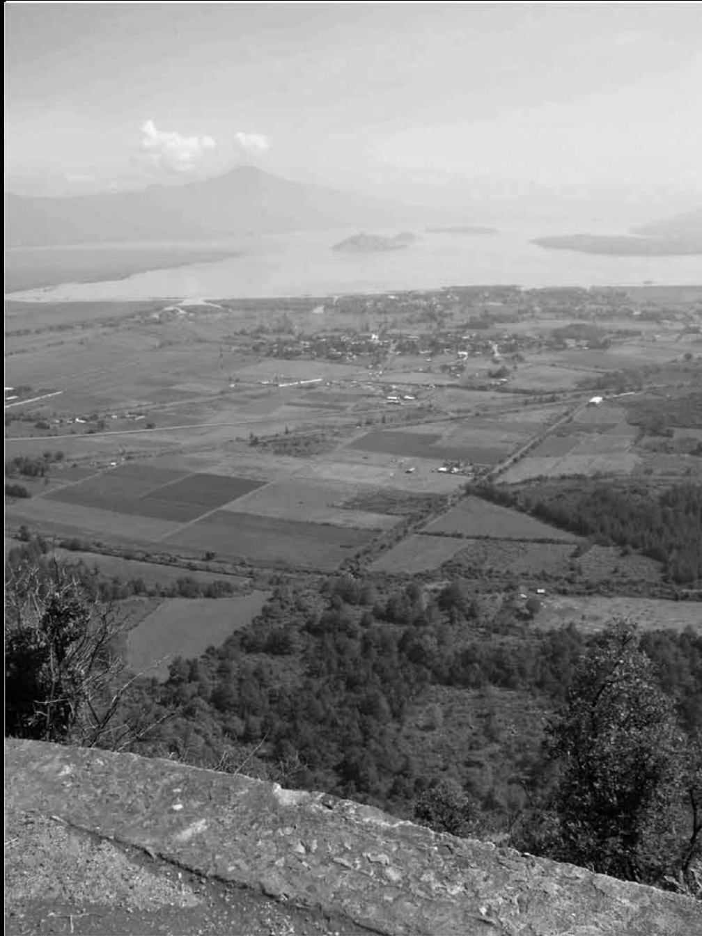
Cuenca Lacustre de Pátzcuaro en el Estado de Michoacán.