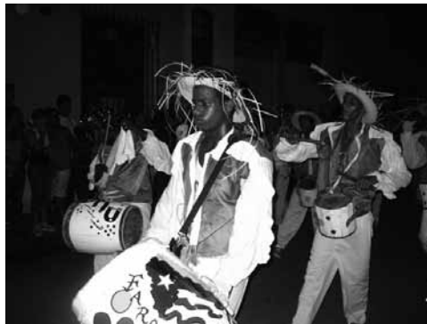
Figura 20: Carnavales de San Juan, fiesta popular tradicional más importante de Camagüey.