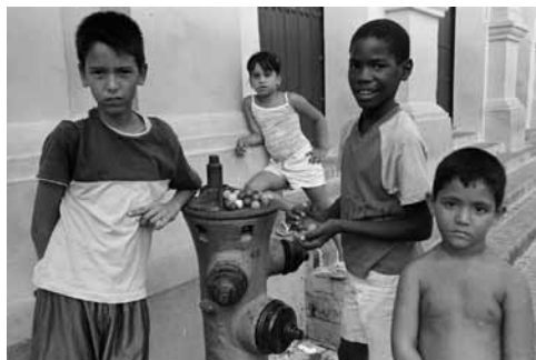
Figura 5: Juegos infantiles tradicionales que generalmente se desarrollan en la calle.