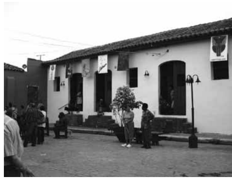
Figura 1: Exposición de artistas de la plástica en la plaza de El Carmen, un espacio que acoge frecuentemente este tipo de actividad.

Por otra parte, para realizar la construcción del proceso de evolución de dicho concepto y de cómo se incluyen los nuevos elementos –componentes, atributos y valores–, encuadramos el siglo xx en cinco períodos que a su vez marcaron cambios en las actitudes frente al patrimonio cultural: un primer momento, hasta 1931, de continuidad de la tradición decimonónica y la edición de la Carta de Atenas de 1931 como primer documento de consenso internacional por la defensa del patrimonio. Un segundo momento, de ruptura, a partir de 1933, cuando se dan a conocer los principios del movimiento moderno en arquitectura y urbanismo, y de desvalorización del patrimonio. Un tercer momento, a partir de 1964, en el cual se promulga la Carta de Venecia , como síntesis de la voluntad de conservación y restauración del patrimonio y en contraposición a su desvalorización y a lo que