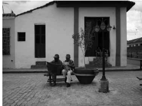
Figura 2: Los vecinos del barrio personificados en barro, en la plaza de El Carmen.

sucede en las ciudades. Un cuarto momento, a partir de 1970, caracterizado por la revalorización de los conjuntos históricos y las definiciones de la unesco. Un quinto momento, a partir de 1990 y extendido hasta la actualidad, determinado por la introducción de numerosos elementos y nociones contemporáneas; en el año 2000, la Carta de Cracovia , que hace definitivamente actual el concepto de patrimonio, y la Convención para la salvaguardia del patrimonio cultural inmaterial en el 2003 (Tabla 1).