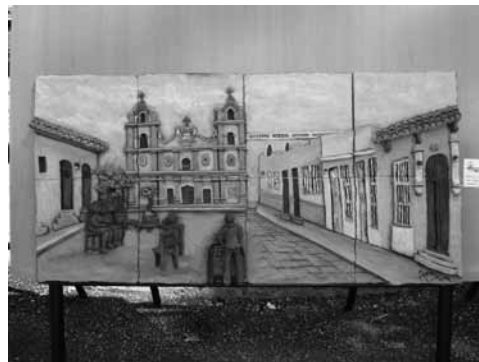
Figura 16: Nuevas formas de trabajar el barro le dan versatilidad al tradicional oficio de la alfarería.

Otro aspecto muy discutido es la inclusión o no de la llamada cultura viva , y cómo los