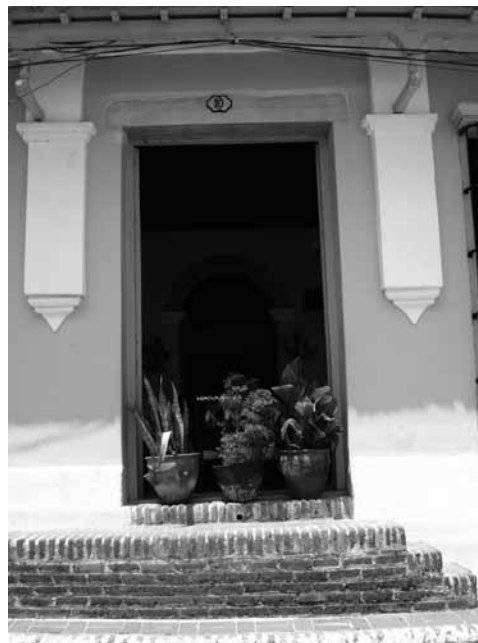
Figura 9: Elementos típicos de la arquitectura más genuina de Camagüey –las pilastras truncadas, el alero de tornapunta y los quicios de acceso de ladrillos de barro–.