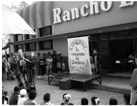
Figura 15: Teatro callejero en la plaza Maceo.

Otro ángulo discutible lo constituyen el valor original y el valor adquirido (Fernández, 1997, p. 56), ya que generalmente se considera el primero, pero en el caso del patrimonio inmaterial se