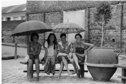
Figura 14: La fiesta del fuego y el barro imprime importancia a la actividad alfarera actual.