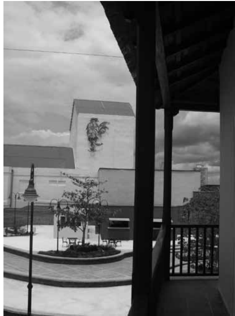
Figura 8: Aporte de los artistas de la plástica en la identificación tradicional de los lugares –la Plaza del Gallo– en el centro histórico de Camagüey.

La experiencia demuestra que la conservación del aspecto físico basada en una reglamentación restrictiva no basta para asegurar en forma permanente la reanimación de los núcleos antiguos de una ciudad en expansión (Gómez, 2009, p. 104). 3