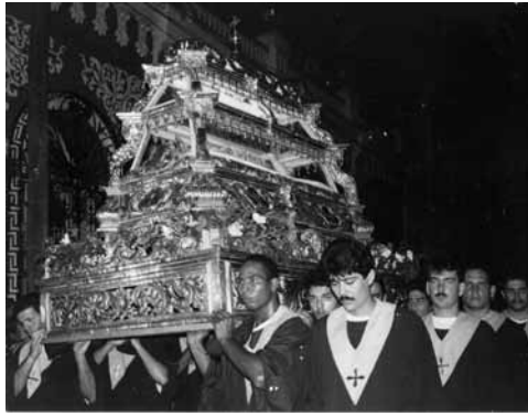
Figura 19: Procesión de Semana Santa con el Santo Sepulcro de la iglesia de La Merced.

Para la elaboración del Plan Parcial del área declarada Patrimonio Mundial (Pascual y otros, 2006), realizado por la Dirección de Plan Maestro de la Oficina del Historiador de la ciudad