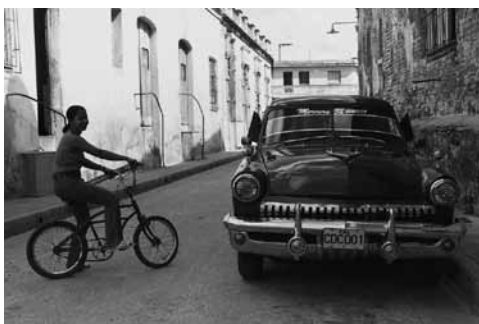
Figura 22: Automóviles antiguos constituyen parte del imaginario cubano.