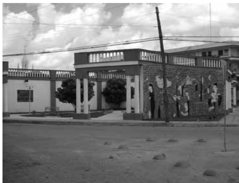
Figura 21: Parque de las Leyendas. Mural del artista de la plástica Joel Jover.

de Camagüey (ohcc) con la dirección metodológica y participación del Centro de Estudios de Conservación de Centros Históricos y Patrimonio Edificado (cecons), se estableció una metodología general, en la que el análisis se realiza a partir del desglose de cada variable que compone la problemática actual del objeto de estudio, donde el desarrollo cultural es la variable que