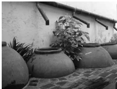
Figura 3: Uno de los elementos identitarios más importantes de Camagüey, el tinajón, que para recolectar agua de lluvia se colocaba en los patios de las casas. Por ello se otorgó a la urbe el apelativo de “ciudad de los tinajones”.

Entre las primeras valoraciones aparecidas para la protección de los monumentos o bienes culturales, enmarcadas en el primer momento, de continuidad de la tradición decimonónica, no se define el patrimonio, solo se menciona. Se le aprecia como monumentos, elementos conmemorativos, obras maestras, o sea, no se concibe aún que otros elementos comunes, populares o