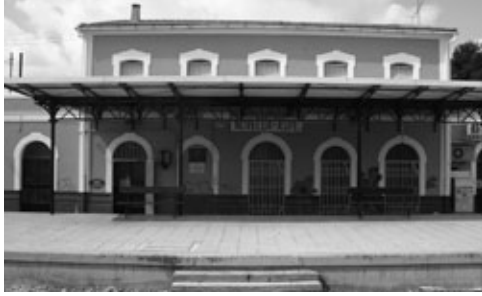
Figura 5: Apeadero de Agost. Propuesta de revitalización.