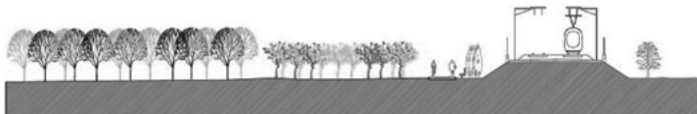
Figura 8: Esquema de diseño del camino en relación a las vías del ferrocarril.

Es necesario, por tanto, recordar que la Vía al Mediterráneo atraviesa múltiples áreas que se pueden agrupar en tres grupos diferenciados: zona urbana, zona interurbana y zona agrícola o de interés paisajístico. Desde el punto de vista de los ecosistemas, la Vía al Mediterráneo abarca desde las montañas del interior hasta las playas de la costa: desde el sistema forestal de las montañas del interior, pasando por las salinas, los espacios cultivados, los marjales de los ríos, hasta el terreno calcáreo y pedregoso, carente de vegetación, de los alrededores de la ciudad de Alicante.