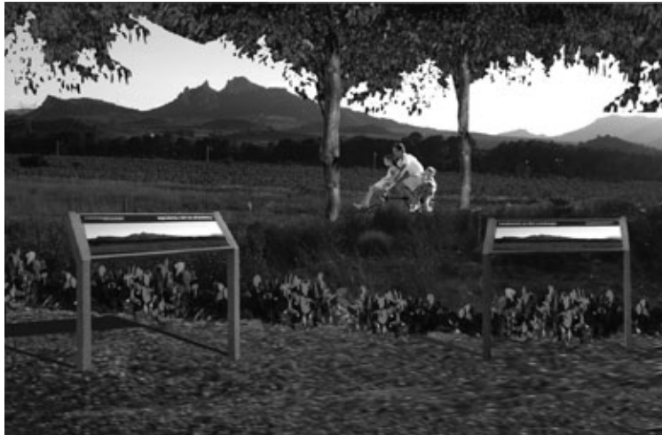
Figura 25: Diseño de zona con paneles informativos.