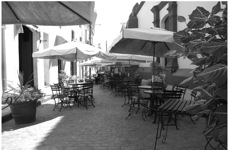
Figura 11: Callejón de la Soledad convertido en área de mesas como extensión del Bodegón Don Cayetano.