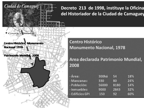
Figura 1: Ciudad de Camagüey, Centro Histórico declarado Monumento Nacional en 1978 y Área declarada Patrimonio Mundial en el 2008.