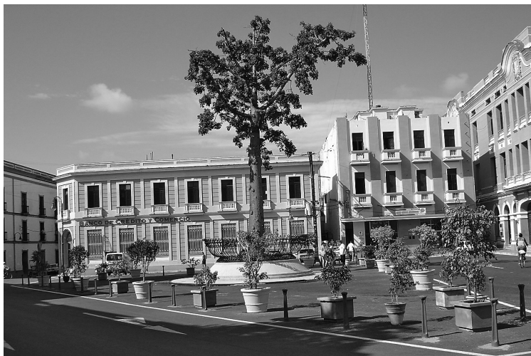
Figura 8: Plaza de los Trabajadores o de La Merced reanimada para el 495 aniversario de la ciudad, coincidente con la Proclamación oficial de Patrimonio Mundial.