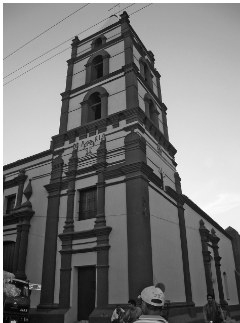
Figura 7: Iglesia de La Soledad restaurada en el 2008. En los últimos diez años se han intervenido todas las iglesias de Centro Histórico.

La participación ciudadana es un gran pilar de esta política, organizada en los diferentes niveles: valoración, planes, proyectos y ejecución; en ellos los actores del territorio aportan sus criterios, opiniones y valoraciones y se les consulta las decisiones a tomar. Varias son las experiencias acumuladas, los “Talleres de Barrio”, donde se plantean y discuten los problemas que afectan al barrio y las posibles soluciones; el proyecto “Fa-