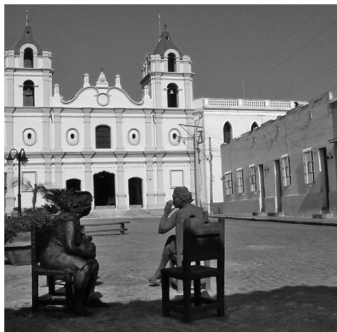
Figura 12: Plaza de El Carmen peatonalizada. Se ha colocado un conjunto escultórico que recoge personajes del propio barrio, y le ha otorgado gran sentido de pertenencia al lugar.