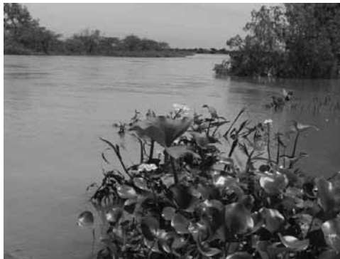
Figura 4: Isla de la localidad de Cayastá.

del río Paraná, de gestión compleja interprovincial o incluso internacional. Por eso, el escrito que aquí se presenta pretende tener tanto un valor de caso –el segmento– como proponer exploraciones sobre aplicaciones más generales a todo el borde fluvial del Paraná, contribuyendo eventualmente a la comprensión de otros bordes fluviales.