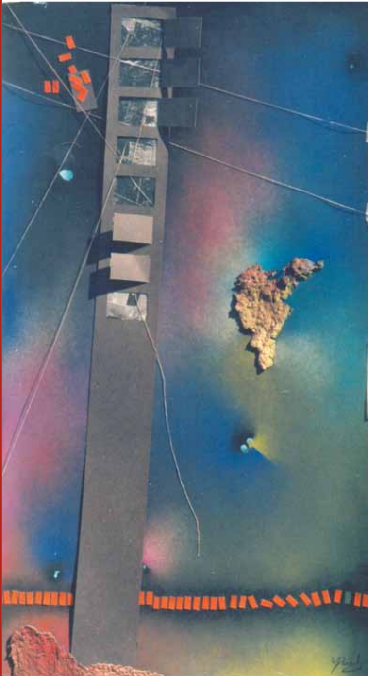
Vistas Serie. Autor: Virginia Farah (1999).