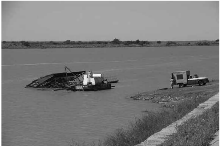
Figura 6: Muelle fotante de la localidad de Intelvecia. Estado actual.

La contraparte de esta característica es la extraordinaria belleza del paisaje de las islas y la cantidad de cuerpos de agua que generan laberintos de casi pura naturaleza. A diferencia de otros tramos del Paraná, aquí se genera una