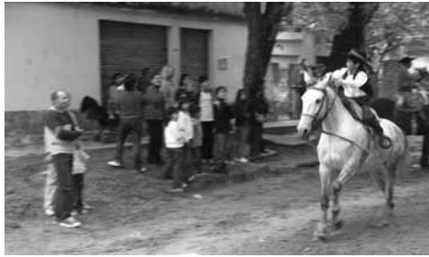
Figura 3: San José del Rincón. Fiesta Patronal.

A pesar de tratarse de un paisaje anfibio, mutante y casi borrado en sus elementos más antiguos, su consideración como paisaje cultural significaría un salto cualitativo en su comprensión y futuro, que podría materializarse tanto en pequeñas acciones de revalorización como en la definición de un parque o un sistema de parques