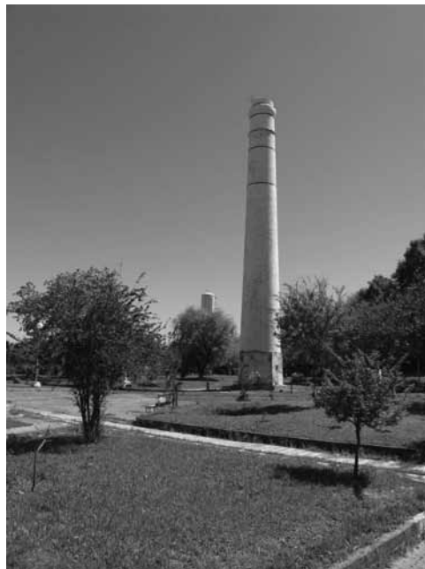
Figura 7: Chimeneas de la localidad de Saladero Cabal. Estado actual.

En tal sentido y específicamente para la jurisdicción de la ciudad de Santa Fe, el tramo de la ruta que se extiende hasta el callejón Laborie presenta una gran densidad histórica, destacándose especialmente los sitios, edificios y episodios vinculados a la cultura de la producción. El antes mencionado puerto de Colastiné con sus dos muelles, operativo hasta pasado el primer cuarto del siglo pasado, tuvo una importancia estratégica dado que permitía embarcar la producción cerealera y maderera de la provincia de Santa Fe.