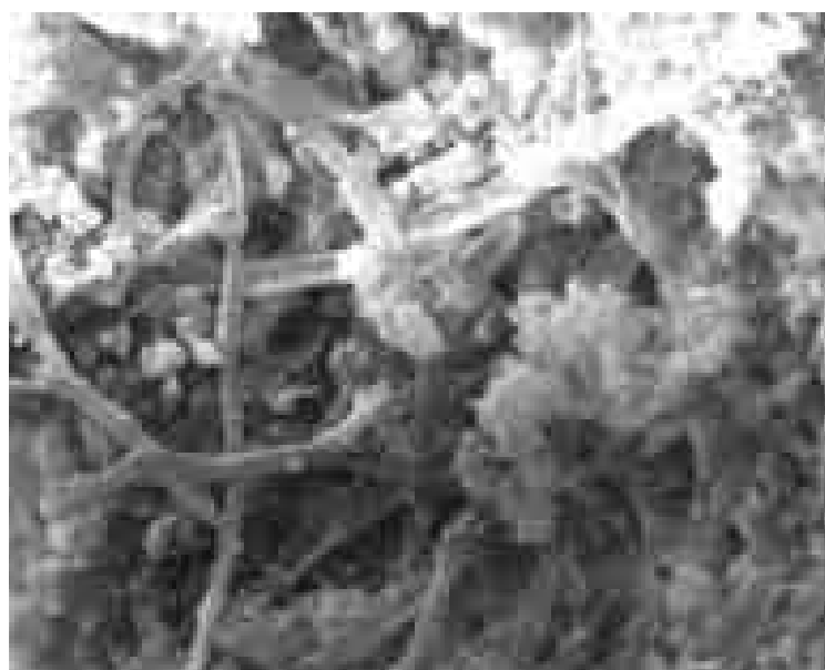
Figura 14: Imagen de microscopio electrónico de barrido de Caloplaca citrina .

Como resultado de las inspecciones realizadas, en la tabla 2 se indica la valoración de los portales según los criterios indicados en el numeral 2, y se informa sobre el estado de conservación que presentan en la actualidad. Debe recordarse que algunos de ellos han sido reparados y puestos en valor en los últimos años. El portal del cementerio de Laprida fue reparado y puesto en valor de acuerdo con un plan preestablecido desde el Gobierno de la provincia de Buenos Aires,