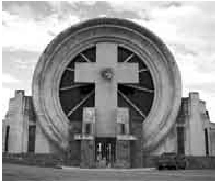
Figura 9: Vista portal del cementerio de la localidad de Saldungaray, luego de su puesta en valor.

Todo el conjunto está realizado en hormigón armado y mampostería revocada con un zócalo de piedra como basamento. El portal se encuentra emplazado a la vera del río Sauce Grande, sector forestado que en la actualidad presenta un alto valor paisajístico.