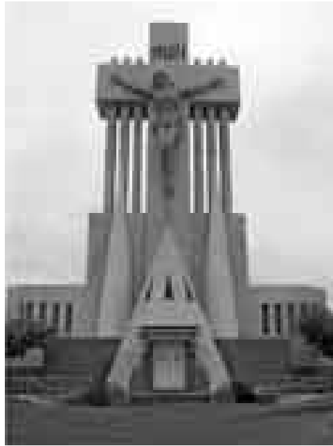
Figura 2: Vista general del portal del cementerio de Laprida.

El conjunto se ubica en una esquina del cementerio, destacándose por su altura y por su desarrollo arquitectónico; en él se observan pilares que sostienen antorchas encendidas