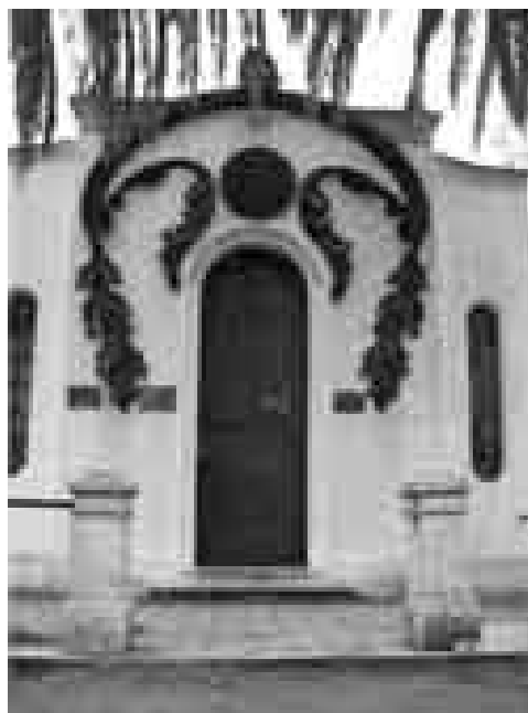
Figura 11: Vista de la bóveda de la familia Saldungaray.