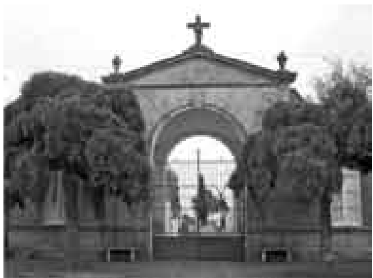
Figura 4: Antiguo ingreso al cementerio de Laprida.