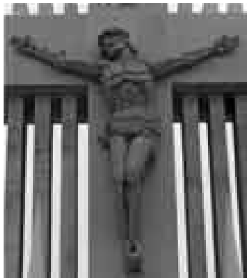
Figura 3: Detalle del Cristo Crucificado.