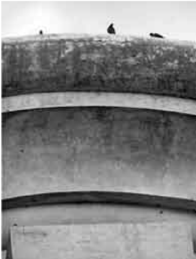
Figura 12: Detalle del borde colonizado del círculo del portal del Cementerio de Saldungaray.