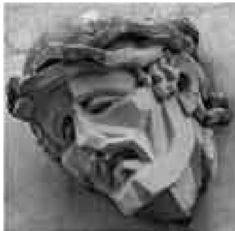
Figura 10: Detalle Cristo, portal del cementerio de Saldungaray.