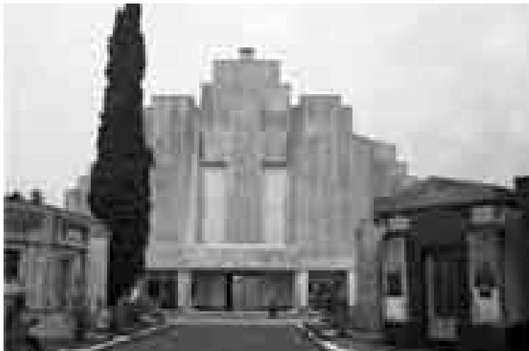
Figura 5: Vista portal del cementerio de la localidad de Azul.