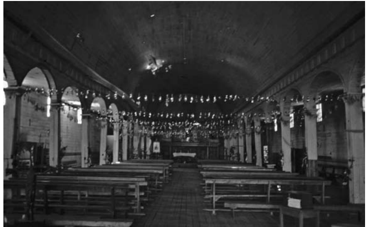
Figura 6: El impresionante espacio del templo de Quinchao, con bóveda de cañón corrido de madera.

La identificación de “poblado” con “capilla” es aquí total. No hay poblado sin capilla, aunque pueda existir capilla sin “poblado”. Pero tampoco la capilla de por sí asegura la consolidación de un entorno construido alrededor de la plaza-atrío y, por ende, a veces encontramos capillas sin case-