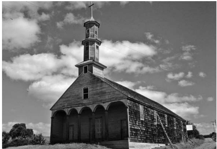
Figura 9: Capilla Villipuri.

Razones de necesidad defensiva de la región llevaban a plantear, luego de la expulsión de los jesuitas, que se concentrase la población en las ciudades localizadas en la Isla Grande (Castro, Chacao y Ancud), despoblando el resto del archipiélago. El autor del proyecto, el ingeniero militar Manuel Zorrilla, lo enviaba al Rey en 1781, pero alguna de sus ideas serían recogidas luego por el gobernador Francisco Hurtado quien piensa en un esquema reduccional impulsado por los misioneros, similar al utilizado en el virreinato del Perú dos siglos antes (AGI, 1781).