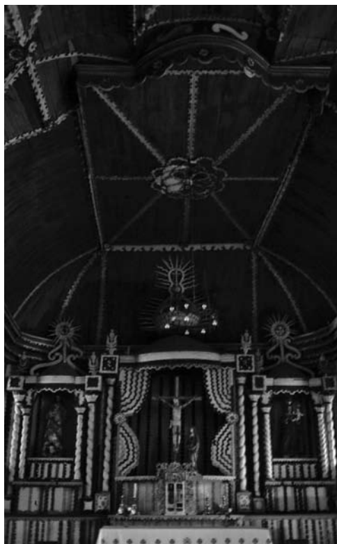
Figura 5: Detalles constructivos de la sacristía de Dalcahue.