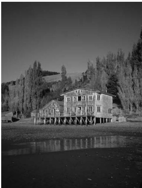
Figura 8: Arquitectura maderera palafítica en las islas de Chiloé.

El pueblo formado en la pampa de Teque e inmediato al Fuerte Real se permitía en algunos casos perforar los centros de manzana, mantener la plaza cuadrada, pero hacer rectangulares las manzanas y proponer casi exentos los edificios públicos relevantes (Rodríguez y Pérez, 1947, p. 219).