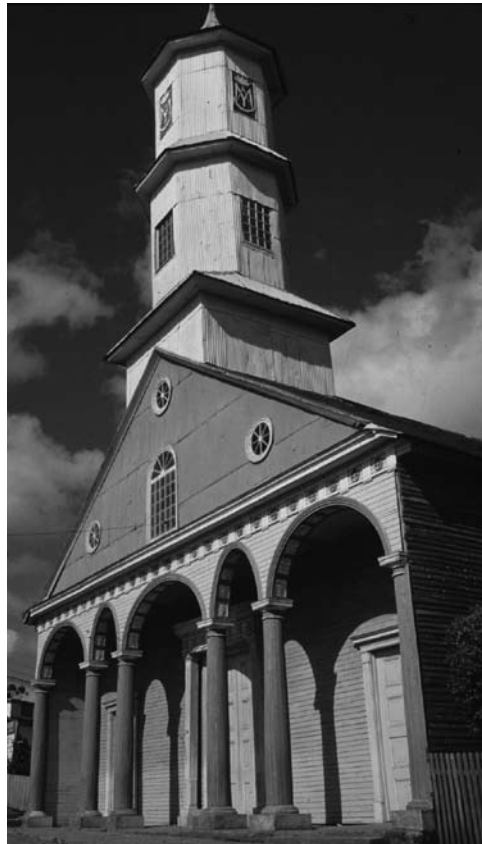
Figura 2: Iglesia de Achao, la única que subsiste de la “Misión Circular” de los jesuitas.