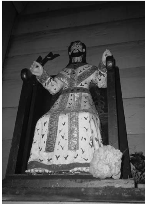
Figura 7: Imaginería popular chilota.

También es preciso acotar que los encomenderos de Chiloé eran en realidad bastante más pobres que los del valle central y otras regiones de Chile. En 1743 ellos declaraban que no tenían “bienes raíces ningunos, ni viñas, ni labranzas, ni matanzas”, por lo cual estas encomiendas no les permitían acumular beneficios ni caudales pro-